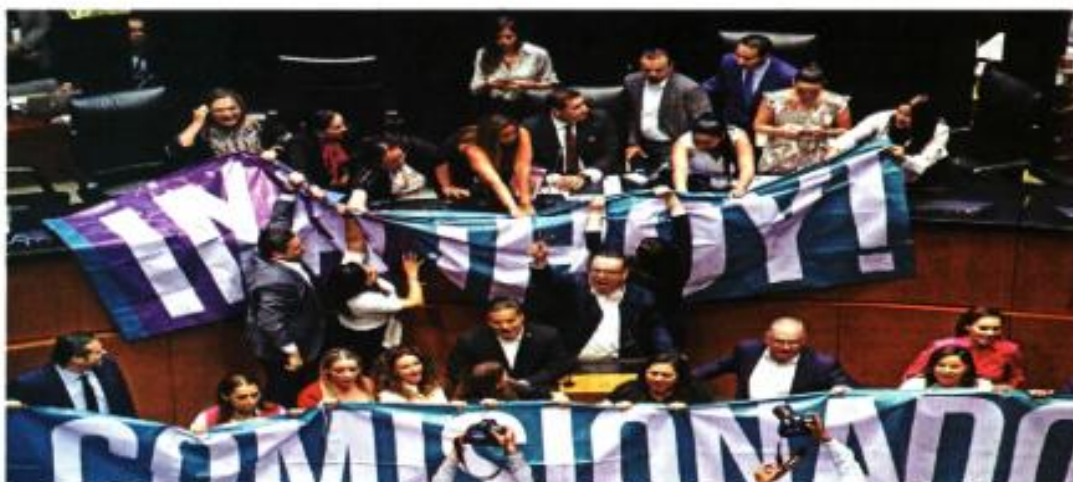
Senadores de oposición tomaron la tribuna y con pancartas exigieron que se vote para constituir a un comité del Inai.

EL DATO Con la toma de tribuna se quedaron 58 reformas pendientes por aprobar, incluidas iniciativas presidenciales.