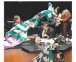
Toma de tribuna.

La oposición se dice "traicionada" y Monreal, artífice de la negociación, admite que su liderazgo está "socavado". PÁG. 10