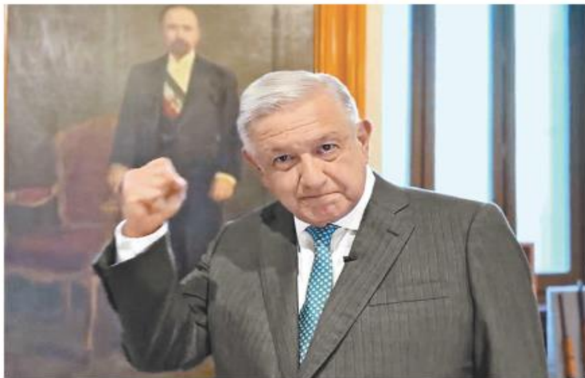
"Fue una especie de vómito, pero no perdí el conocimiento; me pusieron suero y regresé a Ciudad de México, no en camilla". ESPECIAL