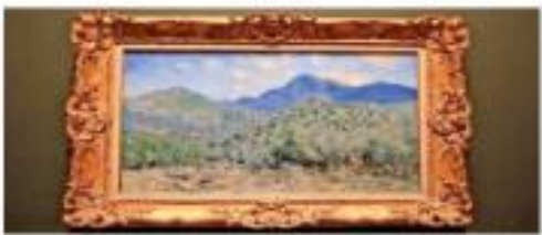
En 1884, Claude Monet pintó Valle de Auvers, cerca de Argenteuil.

Rural, Forestal y Pesquero. El argumento fue que ese organismo desconcentrado no contribuye más al desarrollo del campo y se había convertido en un espacio de deuda y de "reincubación del dinero público hacia el privado". El petista Benjamin Robles aseguró que los beneficiarios de los créditos recibirán "toda o muy poco" al Estado. La oposición criticó que la propuesta haya salido adelante violentando el proceso legislativo.