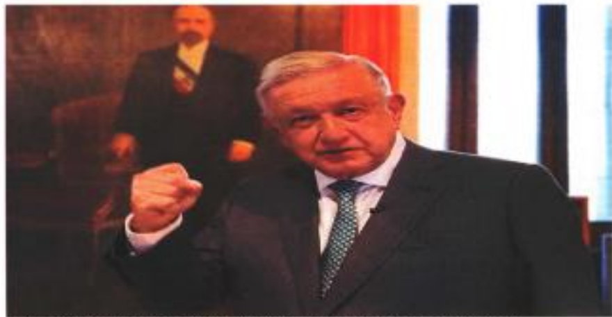
En el video, el Presidente toma al tiempo saturo de pie y recorrió la sala dedicada a Francisco I. Madero.

Reconoce que sufrió "un desmayo transitorio" y lamenta "el odio" de quienes quieren que desaparezca