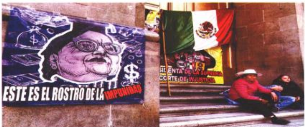
Los integrantes del Frente Nacional Obradorista, en plantón frente a la Suprema Corte, pretén realizar una marcha contra Norma Leticia Piña.

Tradicionalmente, los accesos al inmueble tuvieron que ser resguardados por elementos de la GIN. | NACIÓN | A6