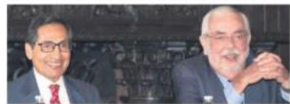
Cátedra SHCP-UNAM 2023. El secretario Ramírez de la O con el rector Graue.