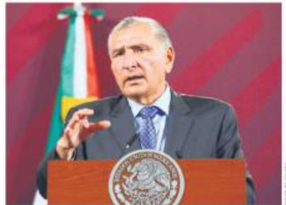
MALQUERIENTES. El presidente goza de cabal salud, dice Adán Augusto López.

ADMITEN CONTROVERSIA. MINISTRA LORETTA ORTIZ RECHAZA QUE INAI OPERE CON 4 COMISIONADOS. PÁG. 26