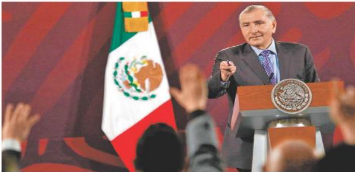
El titular de Gobernación condujo la mañanera y confirmó que el jefe del Ejecutivo convalece en Palacio.

El INAI advirtió que acudiría a la CIDH ante la negativa del Senado de nombrar a los tres comisionados que faltan. PÁG. 9