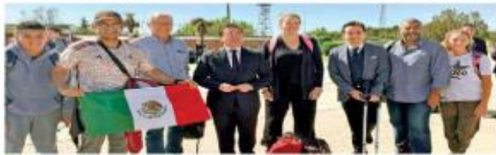
BUEN DE CONFLICTO ARRABADO. EVACUADOS DE SUDÁN LLEGAN A MADRID

En su debut en la actuación —con un cameo en la serie Barry de HBO Max—, el cineasta mexicano Guillermo del Toro interpreta a un músico, un papel escrito especialmente para él.