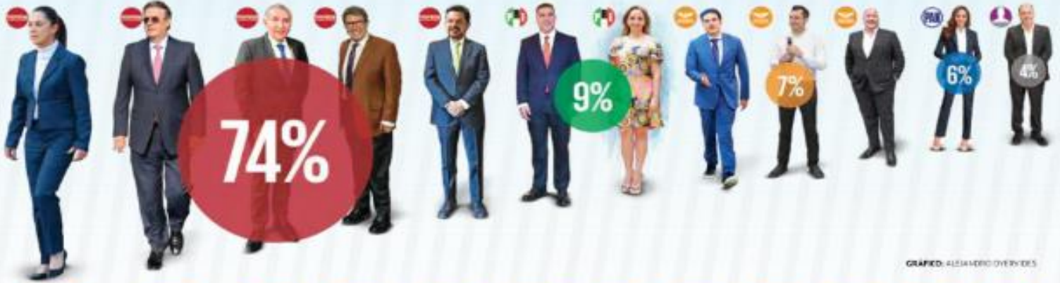
GRÁFICO: ALEJANDRO OYERIDES