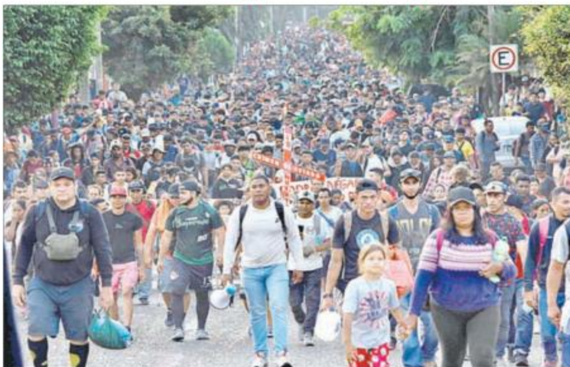
▲ La caravana de migrantes de Venezuela, Honduras y El Salvador, principalmente, con una cruz de madera al frente, recorrió ayer 14