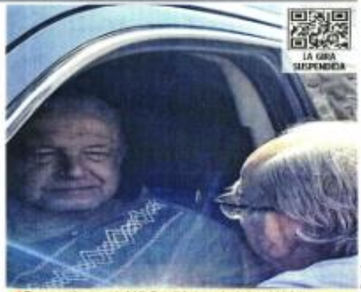
Tras sentirse mal, AMLO salió de su hotel en Mérida, canceló su gira y regresó a la Ciudad de México.

LUNES 24 / ABRIL / 2023 CIUDAD DE MÉXICO 58 PÁGINAS, AÑO XXX NÚMERO 10,703 $ 30.00