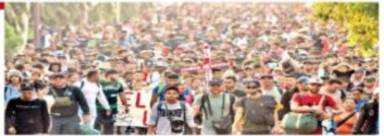
Un nuevo varamu migrante salió de Tapachula, Chiapas, en dirección a la CDMX. Sus integrantes exigen justicia para los 40 hombres que murieron en la estación del INM de Ciudad Juárez, Chihuahua.