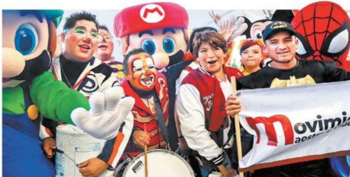
La aspirante morenista en el Estado de México estuvo en Neza (imagen) y Chimalhuacán.