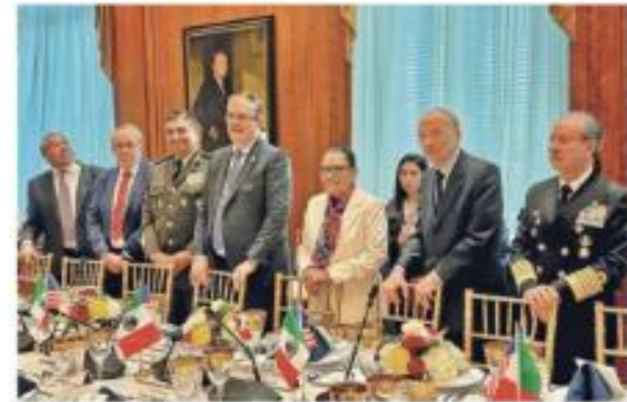
Drástica estrategia. Proponen el país que las FA aumenten vigilancia en aduanas.