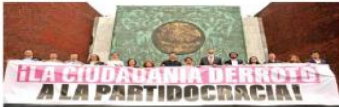
Diputados de MC celebran el freno a la reforma que acota las facultades del Tribunal Electoral.

La caída vez mayor presión ciudadana y de legisladores de todos los partidos metió freno a la reforma para acotar las facultades del Tribunal Electoral del Poder Judicial de la Federación. A pesar de que los coordinadores de las bancadas de Morena, PE, Verde Ecologista, PAN, PRI y PRD habían pasado su aprobación, Acción Nacional se retiró de la mesa de trabajo que buscaba una nueva redacción para tratar de salvar la iniciativa.