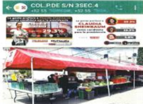
Ferias donde se promociona a la Jefa de Gobierno.

La imagen de la Jefa de Gobierno, Claudia Sheinbaum, es promovida en las Ferias del Bienestar que operan como tianguis y como centros de atención ciudadana itinerante, así como en los grupos de chat vecinales que se crean a partir de este programa. REFORMA constató que en eventos de este tipo, realizados en las últimas dos semanas en las Alcaldías Tlalpan, Iztacalco, Venustiano Carranza y Benito Juárez, se impuso a la Mandataria. "Todo es gracias a nuestra Jefa de Gobierno, Claudia Sheinbaum, gracias a nuestra amiga Claudia Sheinbaum", repite el personal del Gobierno de la Ciudad. Las referencias se extienden también a los grupos de WhatsApp en los que se agrega a beneficiarios de las ferias con la promesa de recibir más información. De acuerdo con un capturas de pantalla, en uno de los chats se compartieron mensajes de popularidad y mensajes en los que se mencionaba a Sheinbaum como