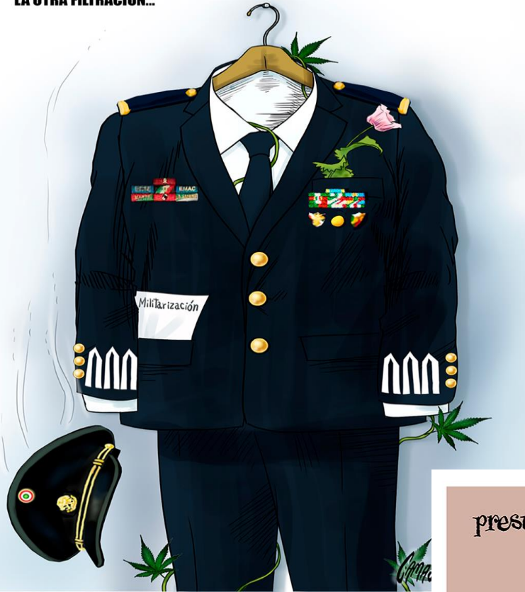
LA OTRA FILTRACIÓN...