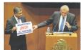
ADÁN. Niega que la FGR haya cancelado aprehensiones por encubrir.

Ayer, el secretario de Gobernación exculpó al Ejército como el responsable de la desaparición de los 43 normalistas de Ayotzinapa. Al comparecer en el Senado, Adán Augusto López dijo que no hubo "una acción concertada" del Ejército como institución, sólo de cuatro militares y ya están detenidos.