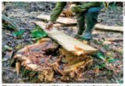
El costo por metro cúbico de esta madera alcanza los 4 mil dólares en el mercado internacional.

servios naturales de ambas países con densas elevaciones se acompañó al grupo élite de guardaparques guatemaltecos, denominados "Gárgolas", que ha alertado de la entrada de traficantes mexicanos a la selva de Guatemala para extraer granadillo, utilizado en tridomesticos y otros productos. Las operaciones ilegales de esta estructura en el "corredor verde", según la investigación, han sido combatidas por Guatemala, al tiempo que en las reservas de Calabunul y Badajón, en Campeche, los guardaparques mexicanos se han visto imposibilitados frente a la mafia mexicana por falta de recursos, personal y apoyo institucional. | NACIÓN | A6