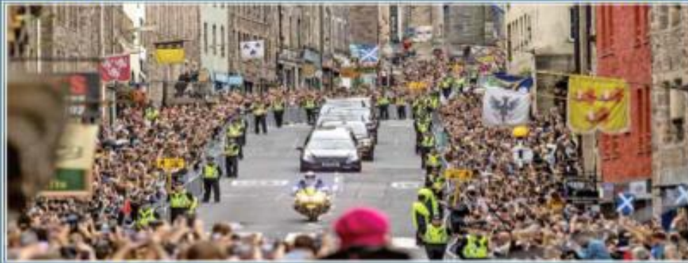
Un trauma para Reino Unido. La muerte de Isabel II representa una ruptura en la identidad nacional que revive la incertidumbre tras el Brexit, consideran especialistas. / 27