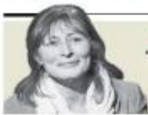
Tatiana Clouthier "Diálogo de Alto Nivel para fortalecer la competitividad" - p. 19