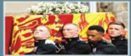
AL TSTAN RTSA EN SU HONOR