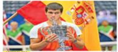
ADRENALINA Se abre una nueva era en el tenis