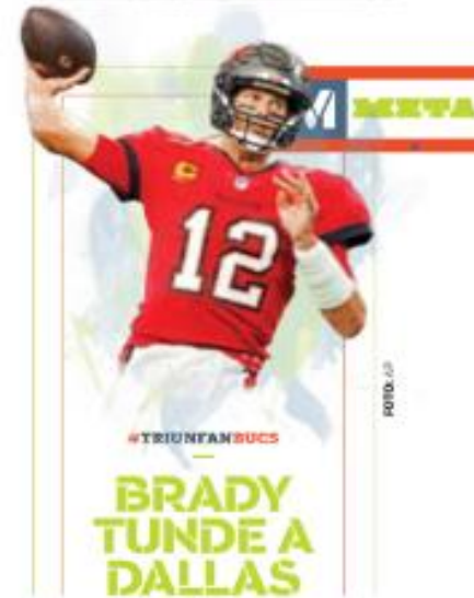
#TRIUNFAN/BUCS BRADY TUNDE A DALLAS