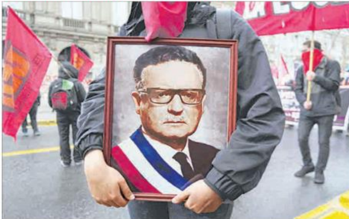
▲ Un manifestante lleva una imagen del presidente Salvador Allende en la movilización en Santiago, la capital chilena, para conmemorar el 49 aniversario del golpe encabezado por Augusto Pinochet, el 11 de septiembre de 1973, para derrocar al gobernante; en la marcha hubo

Boric anuncia búsqueda de desaparecidos en la dictadura