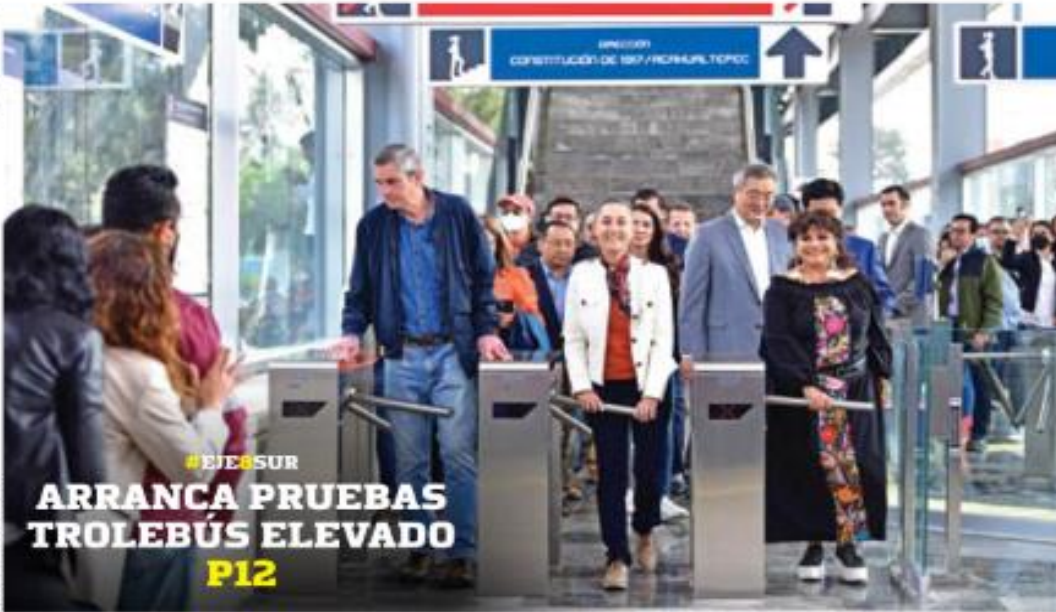
#EJESUR ARRANCA PRUEBAS TROLEBÚS ELEVADO P12