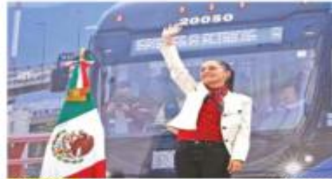
COMUNIDAD Inician pruebas de trolebús elevado

Con la continuidad de la coalición coinciden presidentes nacionales como Roberto Madrazo, Claudia Ruiz Massieu y Beatriz Paredes. PRIMERA / PÁGINA 6