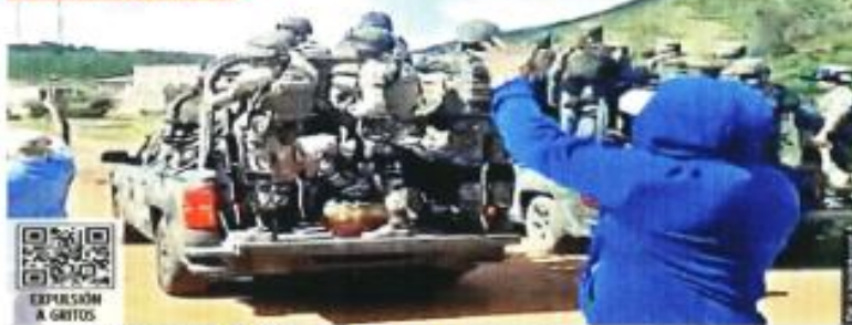
EXPIRACIÓN A Gritos