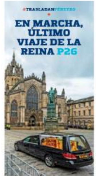
#TRASLADAN/EJESUR EN MARCHA, ÚLTIMO VIAJE DE LA REINA P26