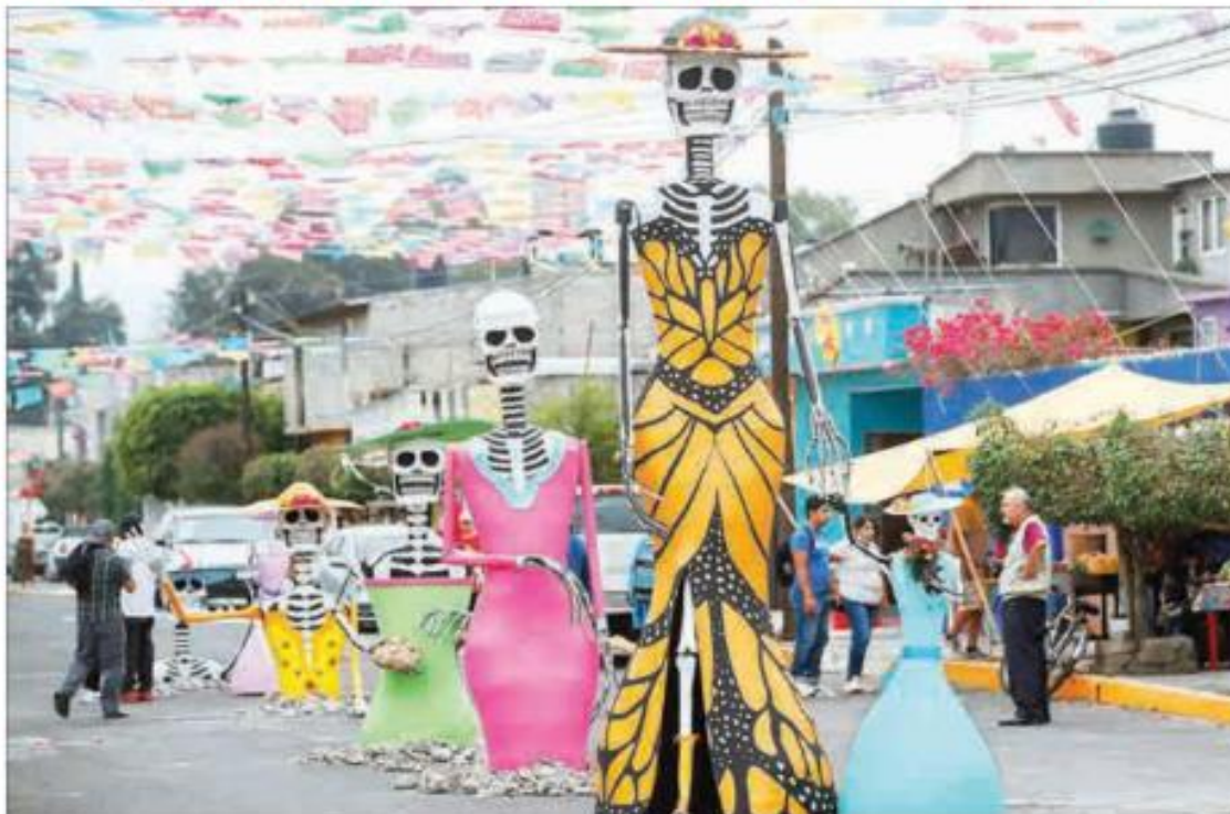
▲ Una idea que surgió en 2011 en la calle Francisco Santiago Borrás, colonia San Cecilia, se convirtió en tradición por los festejos del Día