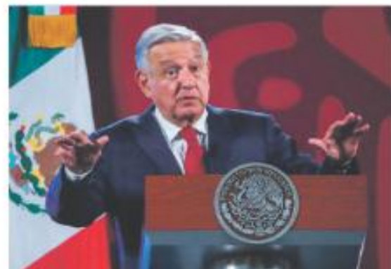
CALIFICA LIBRO. Es un acto de libertad sin pruebas y deshonestidad intelectual.

● PRECIO DE 75 DPE EN 15 INICIA PAÍS PROGRAMA 2023 DE COBERTURA PETROLERA. PÁG. 8