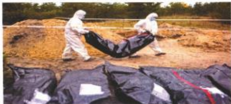
Reporteros forenses cargan una bolsa de plástico con un cadáver durante la extracción de una zona controlada en la ciudad mexicana de Tijuana. Hasta ahora se han recuperado 62 cuerpos.

Estados Unidos presentó un escudo de defensa antimisiles a Ucrania.