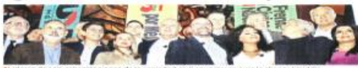
Los líderes de seis organizaciones de la sociedad civil anunciaron ayer la alianza Unidos.

Tras la ruptura de la coalición Ya por México, los representantes de estas agrupaciones llamaron al PRI, PAN y PRD a superar la rivalidad, darle vuelta a la página por la iniciativa de militarización y retomar el diálogo para concretar una coalición electoral. También mencionaron a Movimiento Ciudadano re-