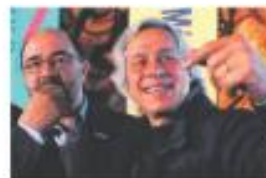
RUMBO A 2023-24. Buscan promover una amplia unidad democrática.

Ante la ruptura de la coalición Va por México, IP y políticos de las organizaciones Frente Cívico Nacional, Poder Ciudadano, Si por México, Sociedad Civil México, UNE México y Unidos por México presentaron la plataforma política Unid@s, que busca unificar al PAN, PRD y MC, y prístas dispuestos a ir por una candidatura única. — Edgardo Ortega / PÁG. 35