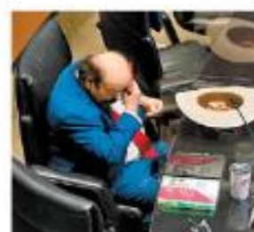
El senador. ESPECIAL

Investiga FGR a Guadiana por operaciones de $273 millones