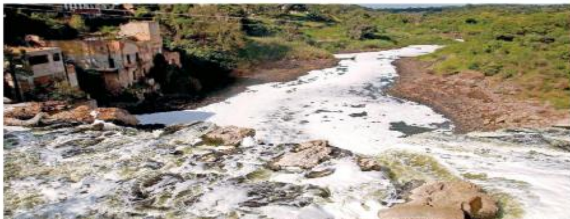
El río Santiago está expuesto a múltiples sustancias químicas y agentes biológicos que impactan en la salud de las poblaciones de municipios de Jalisco y Tlaxcala.