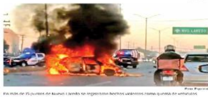
En más de 15 puntos de Nuevo Laredo se registraron hechos violentos como quema de vehículos.