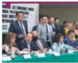
EN FAST TRACK. Votaron 62 legisladores a favor y 48 en contra.