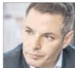
El gobernador de Oaxaca, en la entrevista con La Jornada.