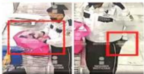
En un flujo de seguridad, un guardia revisa una bolsa, saca un billete y lo mete a su pantalón. Después lo devuelve en su espacio.