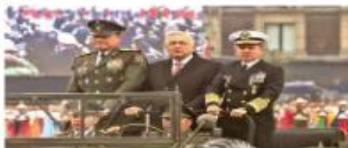
El presidente López Obrador y los secretarios de la Defensa Nacional y Marina encabezaron el desfile por los 112 años de la Revolución. / 10