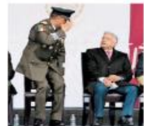
General y Presidente. 2. DÍAZ

— Luis Crescencio Sandoval reitera la "lealtad inquebrantable" de las fuerzas armadas al orden jurídico del país. PÁGS. 6 Y 7