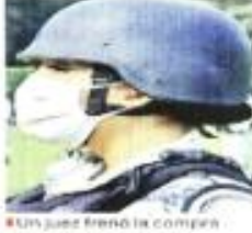
Un juez frenó la compra de cascos para la GN.

Un juez federal suspendió por tiempo indefinido una licitación para comprar 35 mil 840 cascos balísticos tipo militar para la Guardia Nacional (GN), entre acusaciones de favoritismo. Facia una empresa que desde hace años es proveedora del Ejército. El juez Gabriel Bagis ordenó a la Sedena el 18 de octubre detener el concurso y convertir la suspensión provisional en definitiva el 24 de octubre, por lo que pueden pasar varios meses para que se reanude la licitación para adquirir los cascos para 30 por ciento de los agentes de la Guardia. Galvion Ballísticos, proveedor de las fuerzas armadas de EU y Reino Unido, y su socia mexicana Selites, promosionaron al contrato y, desde 2012, han denunciado irregularidades mediante cartas dirigidas al titular de la Sedena, Luis Cresencio Sandoval. Sedena está comprando cascos para la GN al mismo tiempo, está adquiriendo la tecnología para producir otros 61 mil por su cuenta. En sus cartas -reveladas por el Facebook de Guacama-ya-, Selites denuncia favoritismo hacia la empresa PQ Servicios e Infraestructura, que el 19 de octubre de 2021 ganó un contrato de 299 millones de pesos, con anticipo de 100 millones, para la transferencia de tecnología para fabricar los cascos.