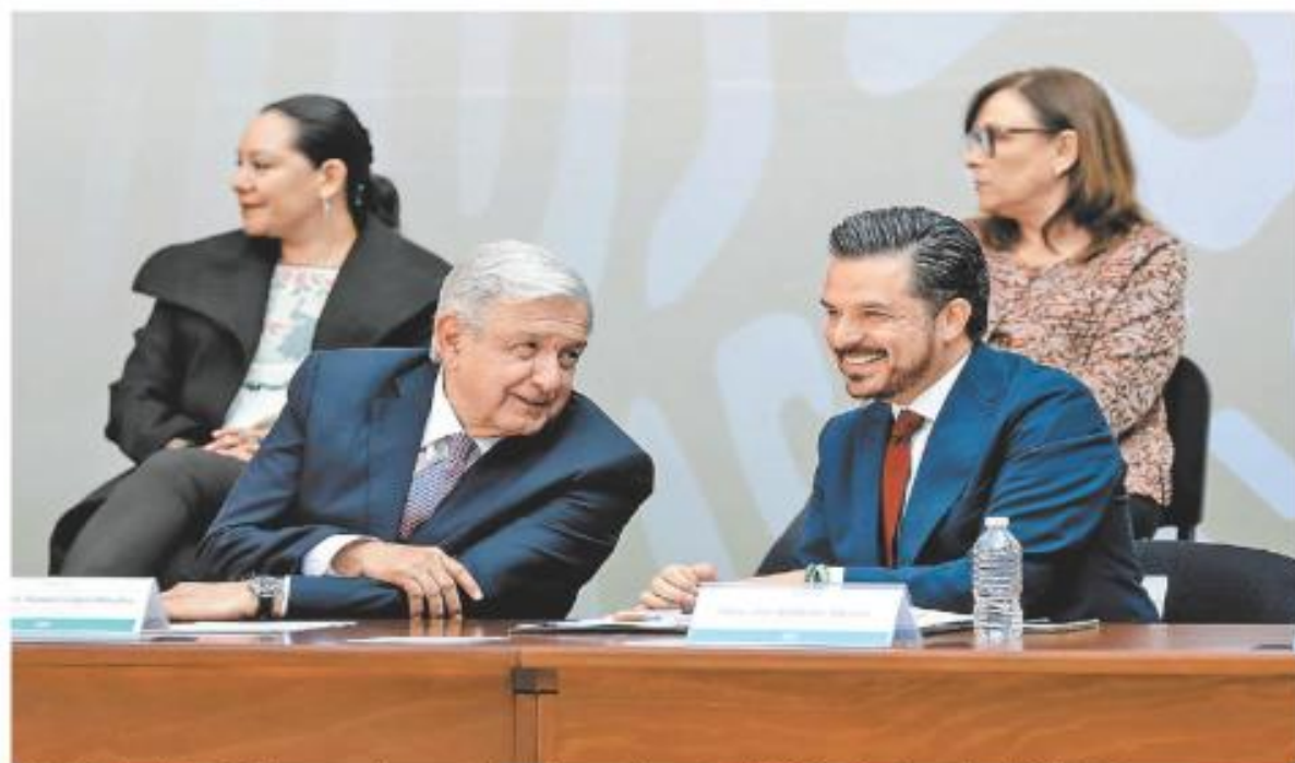
El IMSS aboró 400 mil mdp para mejorar servicios y tiene un director, Zoé Robledo, "de primera", señaló AMLO. PÁG. 10