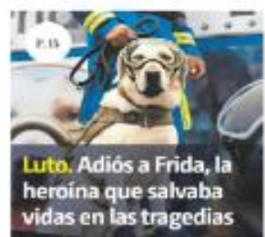
Luto. Adiós a Frida, la heroína que salvaba vidas en las tragedias

Andrés Manuel López Obrador confirmó un plan B en caso de no tener los votos suficientes para su reforma electoral en momentos en que la alianza Va por México da visos de reactivación y el senador morenista Ricardo Monreal ve problemas en la estrategia presidencial. P. 12