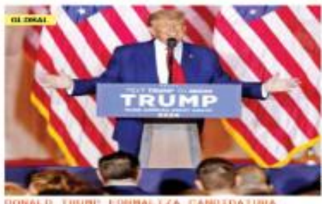
DONALD TRUMP FORTALEZA CANDIDATURA

AMENAZA DE VOLVER Su salida del poder se dio entre caos y enfrentó varias investigaciones por parte de la justicia de Estados Unidos, pero el político republicano anunció que volverá a buscar la presidencia de su país. "El mundo aún no ha visto la gloria real de lo que esta nación puede ser", dijo desde su residencia en Florida. 26