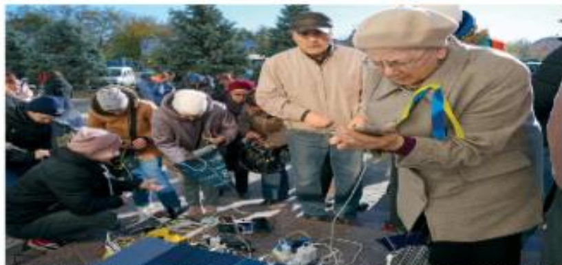
Ucrainos intentan curar sus celulares y hacer llamadas telefónicas en una plaza en Kiev, recuperada de los rusa.