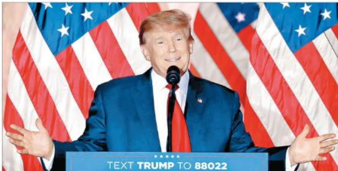
▲ El ex presidente estadounidense anunció su candidatura por el Partido Republicano desde su club privado Mar-a-Lago, en Florida.