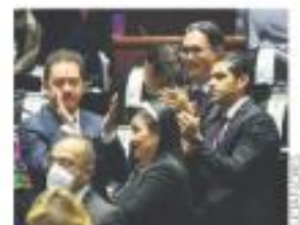
DIPUTADOS. Inician jornadas para discutir más de 2 mil reservas

Con 273 votos a favor y 222 en contra, el pleno de la Cámara de Diputados aprobó, en lo general, el Presupuesto de Egresos 2023. Morena, PVEM y PT avalaron el dictamen, mientras que PAN, PRI, MC y PRD votaron en contra. A partir de hoy, el pleno debatirá por 10 horas diarias las más de 2 mil 400 reservas. —V. Chávez / E. Gazcón / PÁG. 35