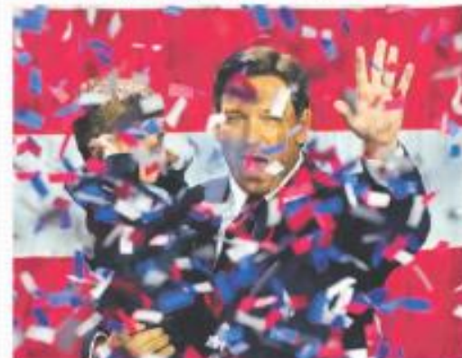
36 GOBERNADORES. Republicanos llevan 14 estados, los demócratas, 6