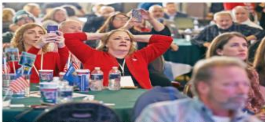
Republicanos observan con desinterés que la marca roja no se cumple en los comicios de medio término.