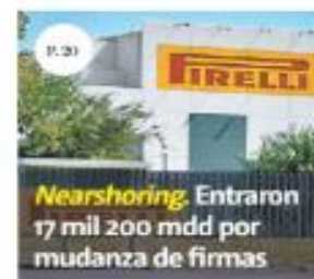
P. 20 Nearshoring. Entraron 17 mil 200 mdd por mudanza de firmas