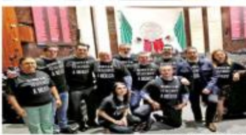
La bancada del PAN subió a la tribuna para criticar los recortes. M de MC se puso pancartas negras con frases de rechazo al INE.

recorte y dijo estar dispuesto a explicarlo a los diputados los requerimientos del instituto. Esto, porque el INE había solicitado cuatro mil