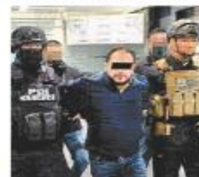
Entrega en CdMx. ESPECIAL

El gobernador de Morelos, Cuauhtémoc Blanco, explica que no puede remover al fiscal y deja el tema al Congreso. PÁGS. 6 A 8