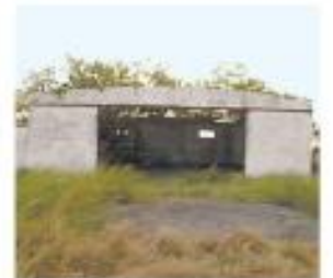
Caso San Fernando.