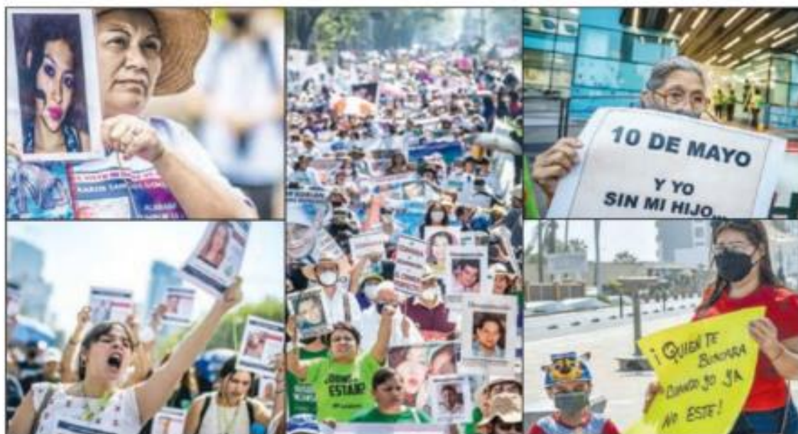
▲ Familiares de desaparecidos desplegaron fotografías de sus seres queridos en varios estados. En las imágenes, Xalapa (izquierda, arriba).