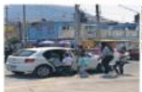
Los taxis irregulares se sitúan en horas pico o cuando hay escasez cerca del Cablebús.

Camuflados entre automóviles particulares, algunos sin cromática, todo irregular, prestan servicio a las afueras de estaciones de las líneas 1 y 2 del Cablebús, donde la Dirección de Tránsito de la Ciudad de México realiza operativos permanentes y los conmina a legalizarse ante la Secretaría de Movilidad (Semoval). | METROPOLI | A12