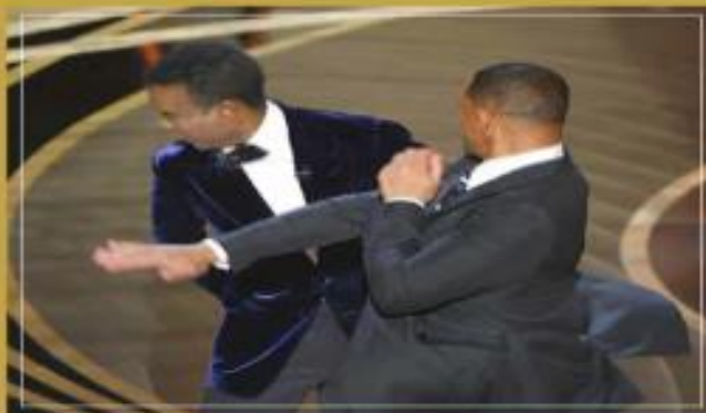
ROMPE LA MAGIA Wil Smith subió al escenario y golpeó a Chris Rock, quien hizo una bromita sobre su esposa, Jada Pinkett Smith.