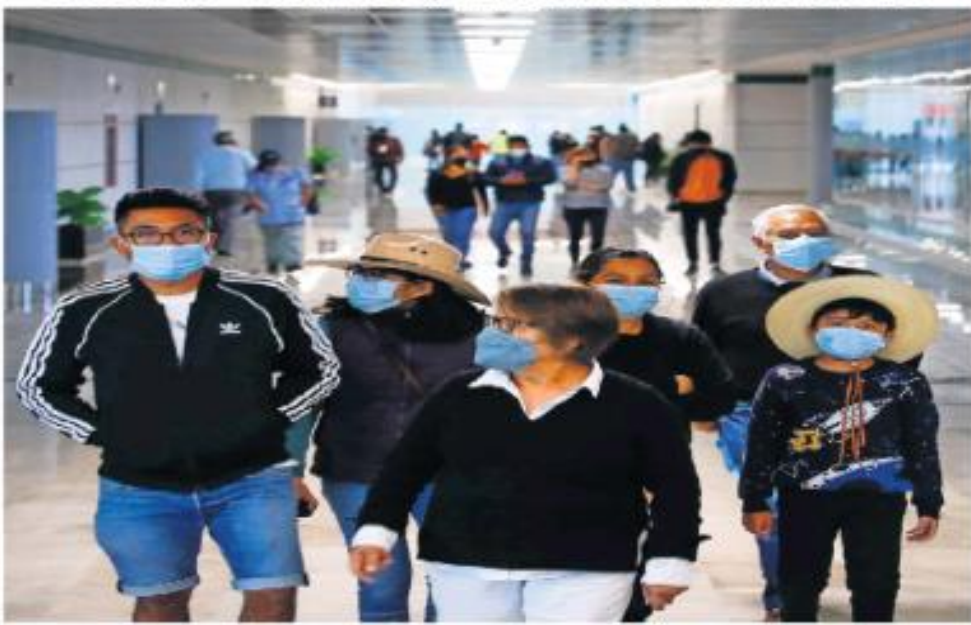
Si bien aún son muy pocos los vuelos que despegan y aterrizan en el Aeropuerto Internacional Felipe Ángeles (AIFA), los pasillos de la terminal lucieron llenos ayer ante la asistencia de cientos de familias que aprovecharon el fin de semana para viajar en las recién inauguradas salas y hasta baños, además de visitar los museos del Maratón y de la Aviación Militar. | NACIÓN | A10 Y A11