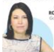
VICTORIA RODRÍGUEZ Gobernadora del Banxico

"... somos sensibles al incremento de tasas, ya sea en pesos o en dólares"