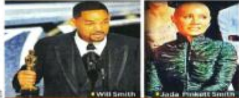
Will Smith y Jada Pinkett Smith

DEL GOZO AL POZO A pesar de salir y mantenerse en la primera posición durante 14 vueltas, Sergio Pérez terminó en cuarto lugar, tras una estrategia fallida de su equipo Red Bull que coincidió con el despiste de Nicholas Latifi y un Safety Car.