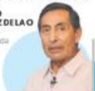
ROGELIO RAMÍREZ DE LA O Secretario de Hacienda

RUMBO A QATAR 2022 El 'Tri' apenas ganó 1-0 a Honduras; tiene pie y medio en el Mundial.