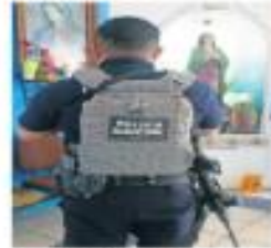
Un policía del Proceso de Revocación de Mandato se encuentra en la Virgen antes de empezar su turno.

En el proyecto de sentencia sobre el recurso, el magistrado Felipe de la Mata Pizarra argumenta que el Poder Legislativo se excedió en el ejercicio de sus facultades, al establecer una excepción que permite que funcionarios difundan propaganda gubernamental rumbo a la consulta, lo que contradice un precepto constitucional. | NACIÓN | A6