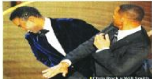
Chris Rock y Will Smith