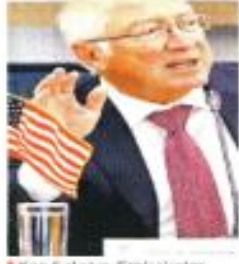
Ken Salazar, Embajador de Estados Unidos.

La reforma eléctrica que discute México debe respetar los contratos y acuerdos previamente establecidos en forma legal, advierte sin confianza en el País no habrá inversión, advirtió ayer el Embajador de Estados Unidos, Ken Salazar.