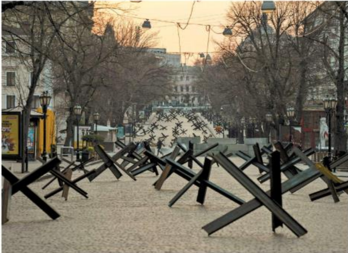
En una imagen digna de la Segunda Guerra Mundial, Odesa se parapeta ante una inminente ofensiva.