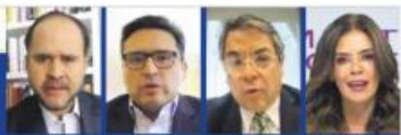
Foro de El Financiero. Reforma de pensiones de 2020 fue acertada, pero insuficiente; quedan pendientes en informalidad y ahorro. / PÁG. 15