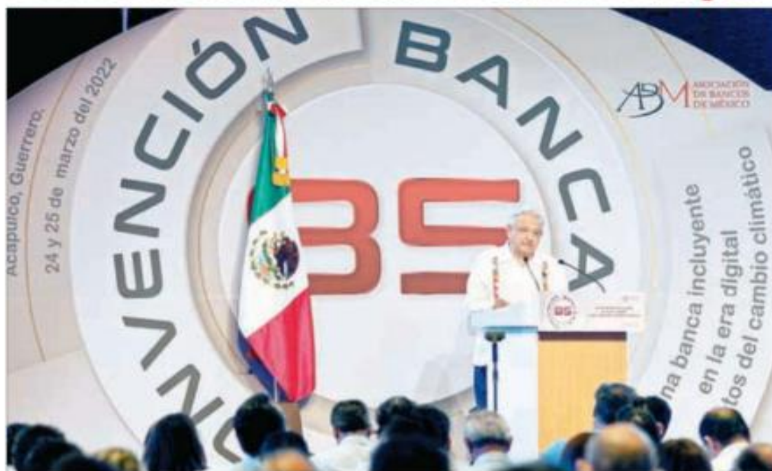
A. En lo que fue su tercera participación en una convención bancaria, el presidente Andrés Manuel López Obrador dijo que la situación favorable del país debe ser motivo de optimismo, debido a que prevalecen la estabilidad económica y social, "sustentadas ambas en el ejercicio de libertades plenas". Mientras, la gobernadora del Banco

Destaca el Presidente situación favorable del país