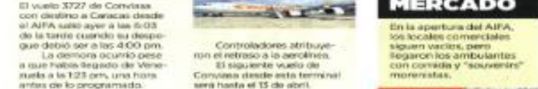
El vuelo 3727 de Conviaxa con destino a Caracas desde el AIFA salió ayer a las 6:03 de la tarde cuando su despegue debió ser a las 4:00 pm. La demora ocurrió pese a que había llegado de Venezuela a las 12:30 pm, una hora antes de lo programado.