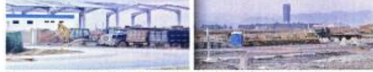
Aunque se inauguró el edificio principal de la terminal, en el AIFA falta concluir la segunda pista, conexiones terrestres, la zona de carga, el tren suburbano, oficinas aduanales y hoteles.