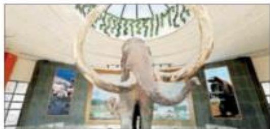
▲ En el AIFA se edificó un pabellón cultural, el cual incluye un museo paleontológico. REDACCIÓN / CULTURA