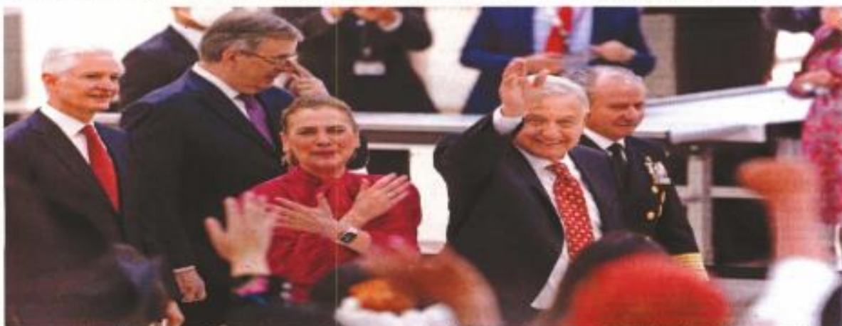
El presidente López Obrador inauguró el aeropuerto, acompañado por su esposa Beatriz Gutiérrez y figuras como el canciller Ibarra y el gobernador Del Maío.