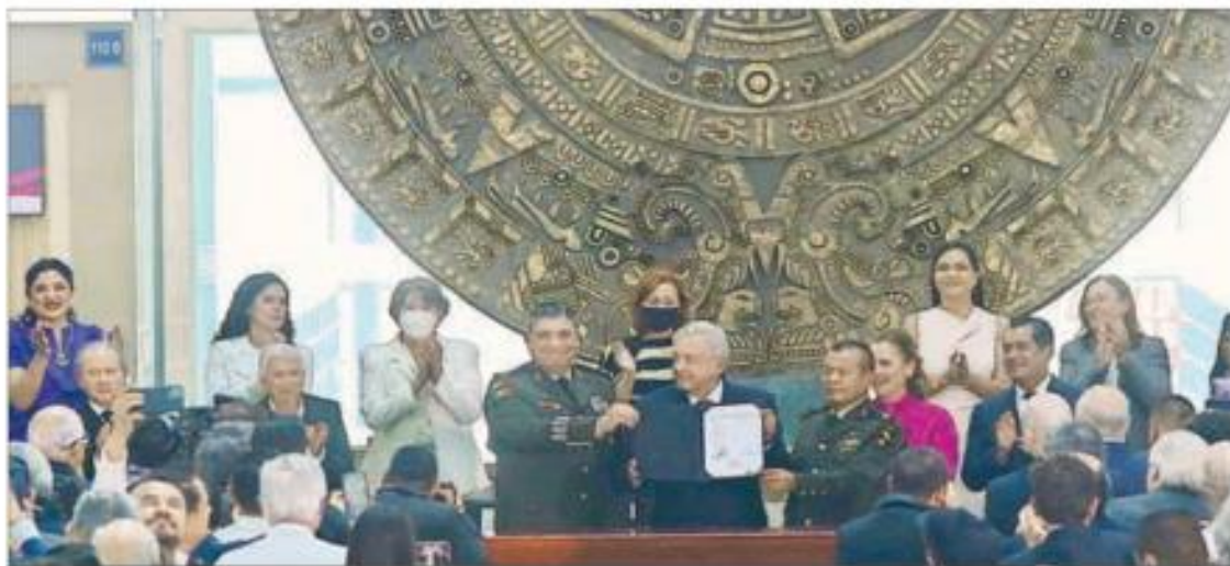
▲ El presidente Andrés Manuel López Obrador encabezó la recepción e inicio de operaciones del Aeropuerto Internacional Felipe Ángeles, en el

ROBERTO GARDUÑO Y FABIOLA MARTÍNEZ / P 2 Y 3