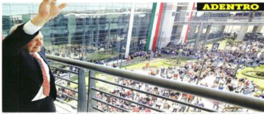
El Aeropuerto Internacional Felipe Ángeles se inauguró ayer con cientos de invitadas, entre ellos funcionarios, gobernadores, empresarios, legisladores y seguidores de Morena.