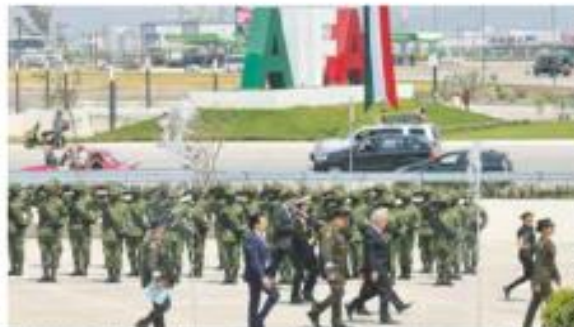
'TOMA VUELO'. Ayer inició operaciones el AIFA, que sepultó al proyecto del NAIM.

La nueva terminal "quedó espectacular", dijo el empresario Carlos Slim. / PÁGS. 36, 37 Y 38