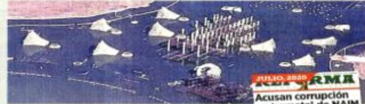
En el Lago de Texcoco siguen los foniles y las estructuras de acero, que la empresa "Gilbert Estructuras" no pudo sacar.

Las empresas que participaron en la licitación para