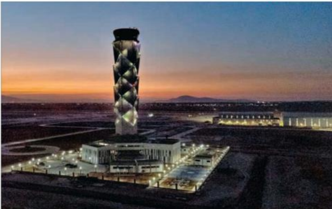
▲ La estructura tiene 88 metros de altura y opera con un sistema de aproximación que permite despegues y aterrizajes simultáneos en todas las pistas, aunque haya niebla cerrada. El Aeropuerto Internacional Felipe Ángeles, de acuerdo con información oficial, es