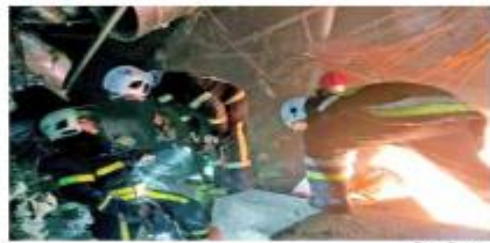
Rescatistas tratan de liberar a personas que quedaron bajo los escombros de un centro comercial impactado por un misil, en Kiev.