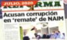
Un contrato por un millón 109 mil pesos sin licitación. Otra irregularidad es que Grupo Gilbert reportó su domicilio en un terreno baldío en Chalco, Edomex.

Pese a ello, la empresa fue contratada por la Sedena hasta septiembre de 2021, pero ahora en lugar de comprarle acero le rentó camionetas en