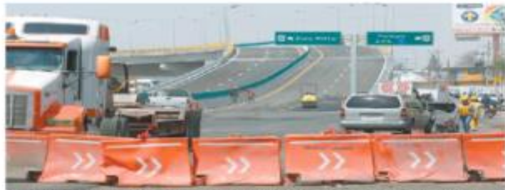
Alrededor del aeropuerto continuaron ayer dando los últimos retoques a las obras.