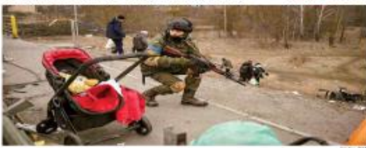
En la ciudad de Kyiv, el ejército de Kiev, Ucrania, combatió los ataques y la fuerza de policía.