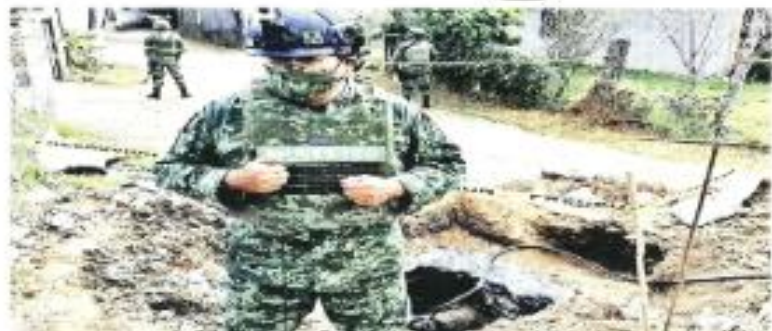
Más de mil militares desplegados en Hidalgo reciben en promedio cada 15 minutos una alerta de tornas clandestinas en los 377 kilómetros de ductos que protegen de los huachicoleros.

«Hacen la norma clandestina por los lados y por debajo para que las autoridades y el personal militar no les más tiempo en detectar», precisó el mando militar durante su recorrido.