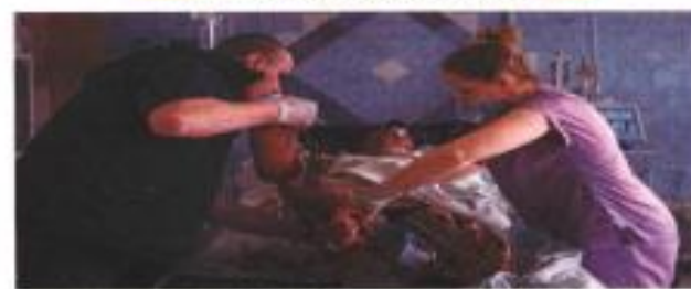
La explosión de una mina dejó a un hombre gravemente herido en Bronny, Ucrania.