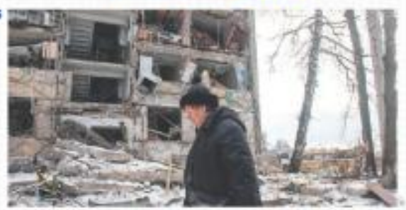
UCRANIA. Las delegaciones negociadoras ven posible un acuerdo de paz.

Rusia pidió a China un apoyo militar y otro tipo de apoyo para la invasión a Ucrania, revelaron funcionarios de EU, por lo que Washington advirtió a China y otros países de "consecuencias" si ayudan a Rusia. — J. López Zamora / PÁG. 34