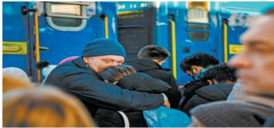
Un hombre se despidió de su hija antes de que ella abordé un tren de evacuación en la estación central de Kiev, Ucrania.