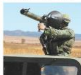
La pieza militar. J. CARRALLO

El denominado Blindado es usado para enfrentar el poder de fuego del cártel Jalisco en estados como Zacatecas. PÁG. 4