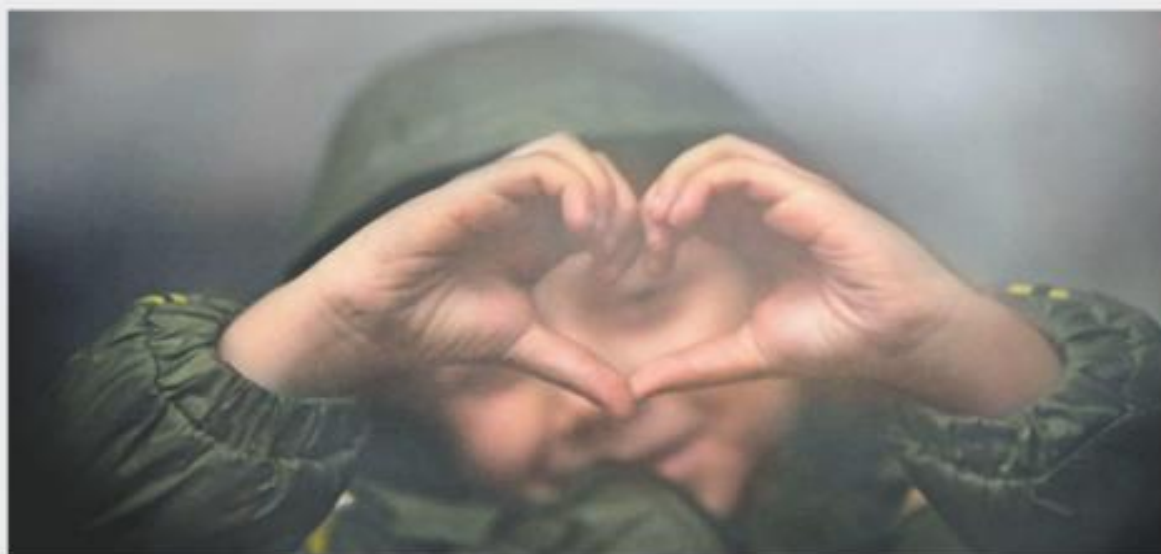
Un menor ucraniano realiza un gesto de fraternidad en la estación de Nyugati, en Bucarest.

Enrique Lendo "Crisis poscovid y el futuro sustentable de las empresas" - P. 18