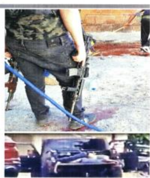
El comando que fue a 17 personas en Michoacán levantó los cuerpos y limpió la escena del crimen.