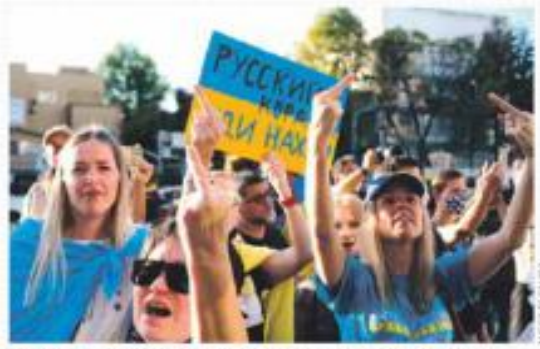
MÉXICO. Ucranianos protestan afuera de la embajada rusa en la CDMX.