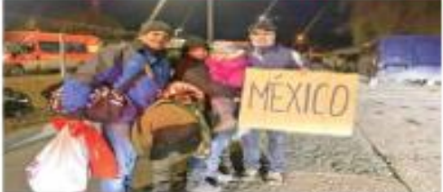
Mexicanos residentes en Kiev llegaron a la Embajada mexicana en Ucrania.

AFP MOSCÚ.— Vladimir Putin, presidente ruso, exigió el reconocimiento de su soberanía sobre Crimea, anexada en 2014, y la desmilitarización y "desnazificación" de Ucrania como condiciones preliminares para negociar con la invasión a ese país.