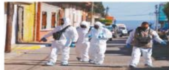
Peritos de la Fiscalía de Justicia de Michoacán revisan la escena en la que ocurrió el enfrentamiento del domingo.