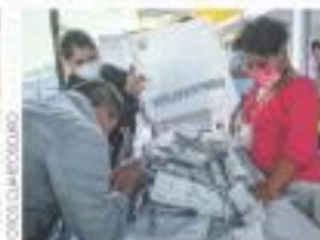
HIDALGO. Luego de 93 años, el PRI pierde. Morena encabeza la primera alternancia.