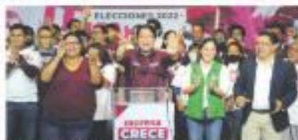
MORENA. Esta semana inicia preparativos para el 2024.