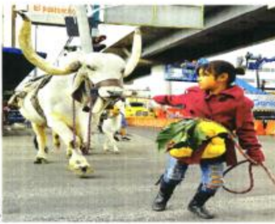
El animal es el sustento de la familia, pues lo llevan a las ferias y cobran 100 pesos por foto. No pueden pagar transporte, por lo que lo hacen siempre a pie.

"En el primer semestre de 2022, 132 mujeres reportaron a la RNR haber sufrido ataques de violencia feminicida, por lo cual, los espacios de protección se han convertido en lugares que salvan vidas y mantienen a las mujeres vivas y sanas", informó la RNR.