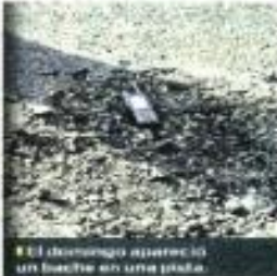
El domingo aparece un bache en una pista.

Concluida esta obra a fin de año se realizará el proyecto ejecutivo para la rehabilitación de la pista 05B/23L, cerrada el domingo pasado por la aparición de un bache que fue reparado en horas.