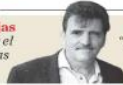
Enrique Serna "Memoria de la libido: Meche, la morena magnética" - P. 37

Violencia. Se le niega la autorización apenas a 1.5 por ciento de solicitantes, pese a la multiplicación de tiroteos que ya alcanzan un total de 370 al corte del 26 de julio