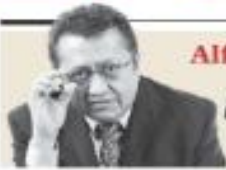
Alfredo Campos Villeda "Ecos de Lenin en las paredes de Palacio Nacional" - P. 2