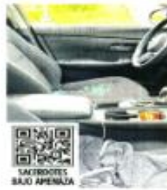
SACERDOTES SAJO APENAZA

En julio de 2020, nuevamente un grupo criminal entró a sus acaes y mató a 26 jóvenes que se encontraban en el centro de rehabilitación.