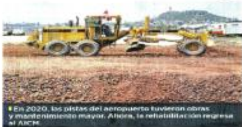
En 2020, las pistas del aeropuerto tuvieron obras y mantenimiento mayor. Ahora, la rehabilitación repasa al AICM.

"Para que se eleven a cabi los trabajos, se cierra la pista entre 23:00 y 05:00 horas, horario en que es menor la demanda de aterrizajes y despegues, y con ello, disminuimos las posibles afectaciones a vuelos", informó el AICM.