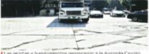
Las grietas y hundimientos regresaron a la Avenida Ceylán.

Sin embargo, dos años después, varios tramos están parchados, agrietados y presentan hundimientos. En un recorrido, REFORMA constató que en el cruce con Calle Domínguez 124, el concreto hidráulico está mto. agrietado y hay un hundimiento en el que camionetas y milés de El 16 de marzo de 2020, la Jefa de Gobierno, Claudia Sheinbaum, entregó las obras de mejoramiento de la avenida, como parte de un programa integral de rescate de