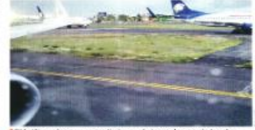
El tráfico aéreo se complicó por el cierre de una de las dos pistas en el AICM.

El miércoles pasado, el AICM había reportado el cierre de esa misma pista para reparar un bache. "La abundante cantidad de lluvias en esta temporada y el constante aterrizaje de aviones provoca el desprendimiento de grava en la zona de trapeo de las aeronaves sobre la pista. Al tratarse de un área crítica requiere su inmediata reparación, para lo cual se tiene que cerrar la pista por seguridad", se informó ayer.