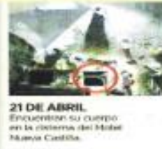
21 DE ABRIL. Encontraron su cuerpo en la cisterna del Hotel Nueva España.