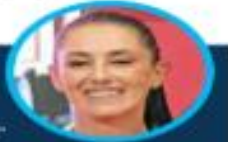
CLAUDIA SHEINBAUM, JEFA DE GOBIERNO DE LA CDMX

Estamos pensando en las familias de la ciudad, estamos pensando en los trabajadores que circulan todos los días."