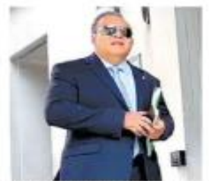
"Trabajo cerca". A. DOMÍNGUEZ

Gestión del consulado Repatrian cuerpos de ocho víctimas del tráiler texano CAROLINA RODRÍGUEZ - PÁG. 8