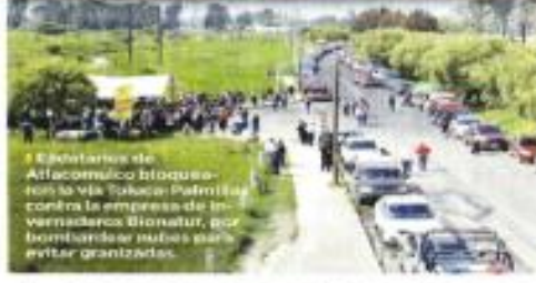
Estudiantes de Añacamilco bloquearon la Vía Toluca-Patrola contra la empresa de Invernaderos Bionatur, por bombardeo nubes para evitar granizadas.

res y Topilejo, ya en la Ciudad de México, se detecta la presencia de células delictivas del Cártel de Tlahuaca, Los Guerreros o Los Simóns. También otras células de la Unión de Tepetitl, una fracción de La Familia Michoacana que opera en el oriente de la Ciudad de México, La Amal Unión, Los Benjás y Ronda 88, que también prestan fuerza en las Alcaldías de Cucoyaco, Tlalpán, Xochimilco y Cuauhtémoc. Estos grupos reciben paquetes de cocina desde Acapulco y Zihuatanejo, vía Chilpancingo-Ignacia-Taxco, en Guerrero, luego Morelos y la México-Cuernavaca, para su distribución en el mercado de narcoconsumo.