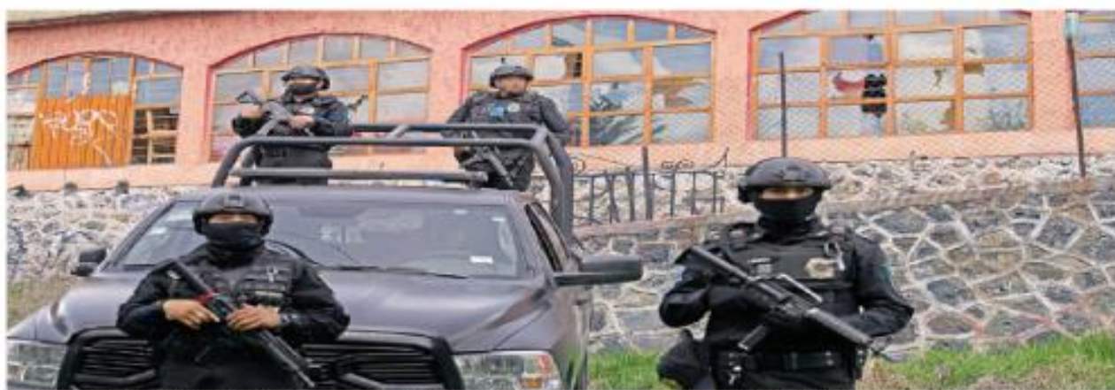
Puestos de Tránsito de la Secretaría de Seguridad Ciudadana controlan el tráfico en el que se registró la detección con el grupo criminal ligado al Cártel de Sinaloa.