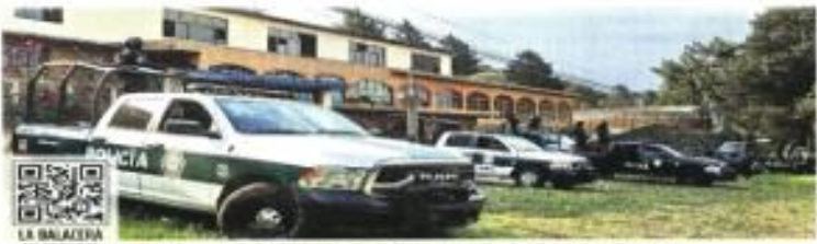
LA BALACERA EN TOPILEJO ■ La Policía de la CDMX indaga la operación del Cártel de Sinaloa.

El enfrentamiento este martes con un grupo armado del Cártel de Sinaloa, bajo el mando de los hijos de "El Chapo", exhibió la fuerte presencia de estas células. Informes militares dan cuenta de la proliferación de células delictivas que dependen de otros cárteles, y que les pagan piso o son sus ferreteros en la región que tiene conexión a territorios más ricos como Oaxaca, Na-