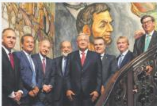
EMPRESARIOS. Cooperación e inversión, temas abordados con AMLO.