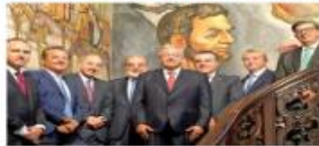
Empresarios de México y Estados Unidos se reunieron ayer con el presidente Andrés Manuel López Obrador en Washington, DC.