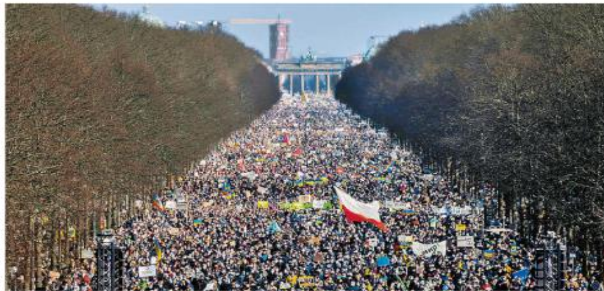
Miles de personas protestaron ayer contra la guerra en Londres, Roma, Berlín (imagen), Madrid y Moscú.