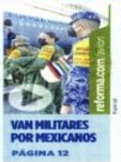
VAN MILITARES POR MEXICANOS

Vladimir Putin elevó sus amenazas ayer: "Los países occidentales no solo están tomando medidas hostiles contra nuestro país en la esfera económica, sino que atosigan a los funcionarios de los principales miembros de la OTAN haciendo declaraciones agresivas reple-