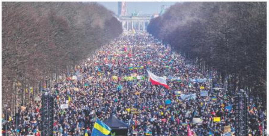
SOLIDARIDAD. Cientos de miles de personas se manifestaron en ciudades europeas, como en Berlín, contra la ofensiva de Rusia y a favor de Ucrania.