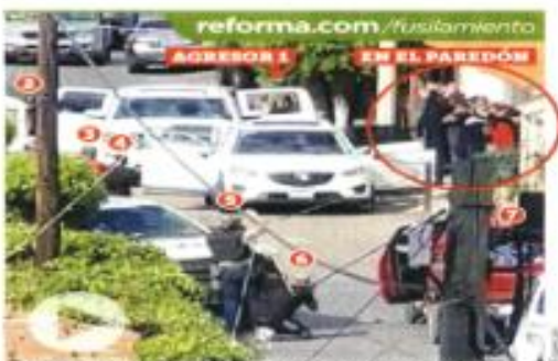
Parapetados detrás de las camionetas blancas, al menos siete agresores dispararon a los rehenes colocados contra la pared y con las manos en la nuca en San José de Gracia.

"Escuchamos fuertes detonaciones durante un buen rato", confesó un agente de seguridad de la localidad. Eran alrededor de las 17:00 horas cuando recibieron el primer reporte.