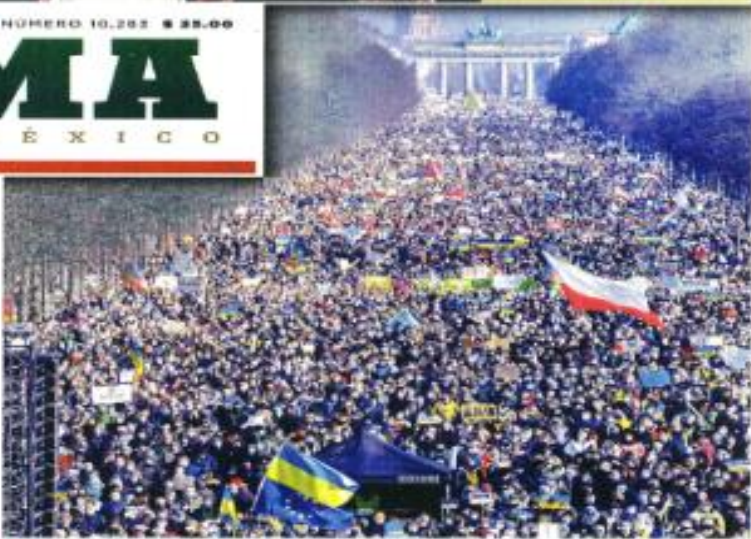
En las capitales de países europeos, miles de personas salieron a las calles para protestar por la invasión rusa. En Berlín (foto) se manifestaron más de 100 mil personas.

"Se exhortan a la ciudadanía en general de la región a denunciar cualquier suceso delictivo, y aportar datos sobre el evento en San José de Gracia que lleve a la captura de los presuntos responsables", urgió el Gobierno estatal, que encabezó el ministro Alfredo Ramírez Bedolla.