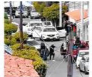
Ejecución grabada. ESPECIAL

Un comando entró a un velorio en San José de Gracia, de donde sacó a 10 personas, las formó en un muro y las acribilló. PÁGS. 2