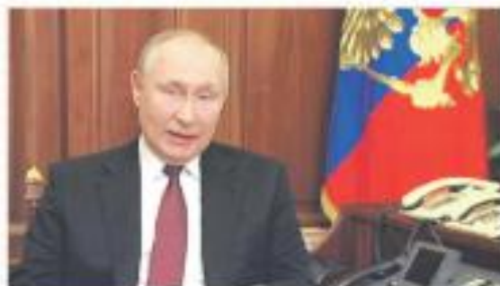
AMENAZA PUTIN. El presidente ruso anunció una respuesta inmediata a cualquier interposición y "las consecuencias que jamás habrán visto en su historia".

DESAFÍO. 'El mundo hará que Rusia rinda cuentas' de esta guerra: Biden