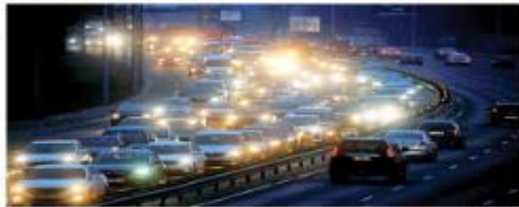
A bordo de sus jets, miles de ucranianos observaron desde primera hora las calles de Kiev, en su intento por escapar de la capital de su país, luego de los primeros ataques por parte de Rusia.

Además, que EE.UU. y sus aliados responderán de manera rápida y decisiva. Hoy se reunirá con los líderes del G7.