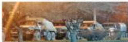
Se buscan militares rusos para enviar los tropas a las zonas de Donetsk.