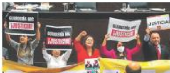
ABC. Diez grupos de legisladores pesaron en la votación, a la medida de la ley, a la

sangró la herida del PAN y encendió los ánimos en San Lázaro, donde Morena y PT se fueron contra el panismo con un coro de ¡a-b-c! — V. Chávez / PÁG. 37