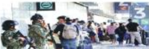
Con más tres vuelos desde acciones, sales de llegada y salida, fuerza aérea de rodaje en la terminal aérea.