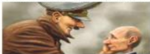
Ucrania compartió en Twitter una caricatura de Putin con Hitler.