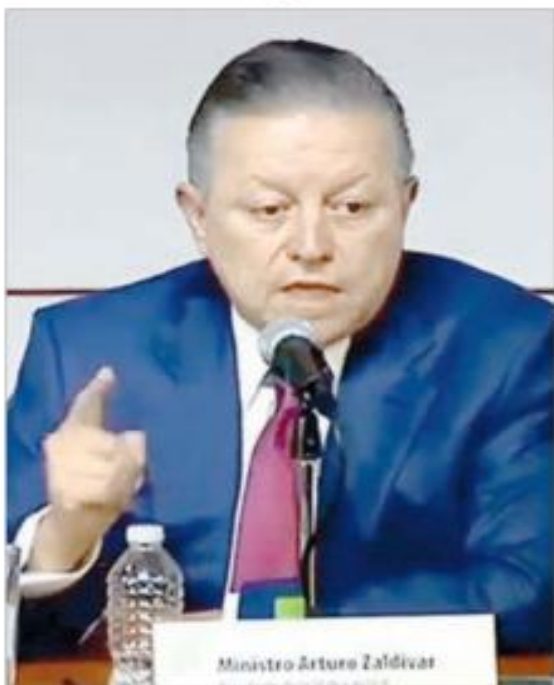
Ministro Arturo Zaldívar

A. Durante la presentación de su libro 10 años de derechos. Autobiografía jurisprudencial , Arturo Zaldívar, presidente de la Corte, reveló pormenores del caso de la guardería ABC, el cual lo fue asignado; en el incendio, ocurrido en Hermosillo, Sonora, en 2009,