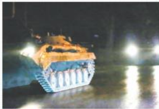
REGIÓN REBELDE. Vehículos blindados ruedan en calles de la zona de Donetsk.