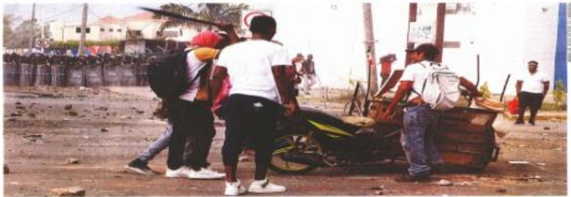
Tapachula, Chiapas.— Migrantes de África y Haití se enfrentaron ayer a palos y piedras con elementos de la Guardia Nacional afuera de la oficina del Instituto Nacional de Migración. La protesta estalló luego de que encontraron tirados en la basura de un baño del INM los documentos para su cita, para regularizar su situación en el país. | ESTADOS | A14