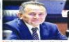
El senador Pech sustituyó a Roberto Palatruco en la candidatura de MC.

pañía representada por el entonces Rector adquirió 3 camionetas Mazda CX4 y una Mazda CX9 por un total de 1 millón 350 mil 800 pesos. Con el resto, hizo transferencias a distintas empresas.