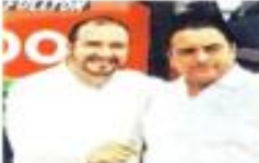
Pech Galera y el ex Gobernador Borge.