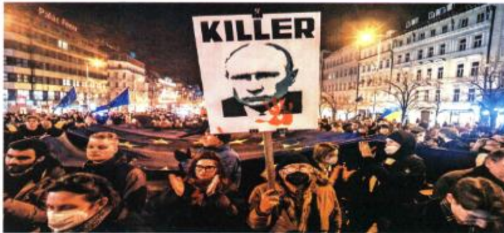
En ciudades europeas, como Praga, hubo marchas contra la decisión de Putin de enviar tropas a zonas separatistas de Ucrania.

JOE BIDEN: ESTAMOS UNIDOS CONTRA LA AGRESIÓN