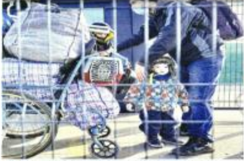
Habitantes de las zonas controladas por los rebeldes ucranianos, comenzaron a abandonar la región.

La U.S. Soccer se compromete a ofrecer la misma remuneración a las Selecciones Nacionales Femeninas y Masculinas en todos los duelos amistosos y torneos, incluido el Mundial. CANCHA