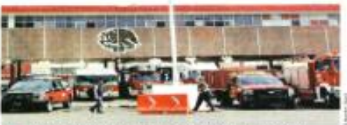
La zona de dormitorios de los bomberos en la Estación Central, tiene daños estructurales desde el 1995.

de cárcel a quienes toman los puntos de peaje en el País. E incluso en Guerrero, recientemente la Guardia Nacional enfrentó a informalistas que lanzaron un trailer sin frenos porque fueron impedidos a tomar la caseta de la autopista México-Acapulco. En el retón de la carretera México-Nagüa, a la altura de la estación del Danzante Viajero en Cd. Obregón, REFORMA constató que al menos 20 hombres controlan el retén en la vía que es paso obligado para camiones de carga que se dirigen a Estados Unidos, y según fuentes estatales, la acción está ligada al crimen organizado.