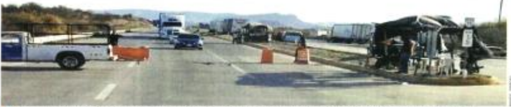
Yaquis instalaron una caseta de cobro en Ciudad Obregón, Sonora, en la ruta de camiones de carga que se dirigen a EU.

Desiste gobierno de impedir ocupación de puntos de peaje