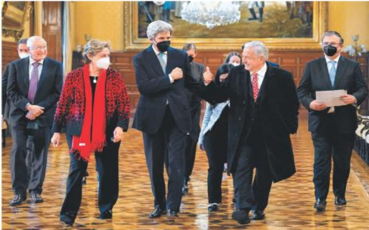
El envío de Joe Biden para el tema del cuidado ambiental y AMLO al término de su encuentro en Palacio Nacional. ESPECIAL

Maruan Soto Antaki "Realidad: a falta de ética, no hay límites ni futuros" - P. 20