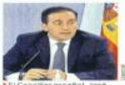
El Canciller español, José Manuel Albarés.

El Gobierno del Presidente Andrés Manuel López Obrador fue cuestionado por descalificar las relaciones con España y diplomáticos mexicanos advirtieron que es una falta decretar una "pausa".