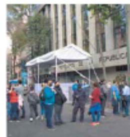
EXPECTATIVA. Trabajadores permitieron ajenos al proceso.

NASDAQ CAE 9% EN ENERO, LA MAYOR BAJA EN 14 AÑOS TIENEN MERCADOS MUNDIALES EL PEOR MES DESDE QUE HAY PANDEMIA. PÁG. 12