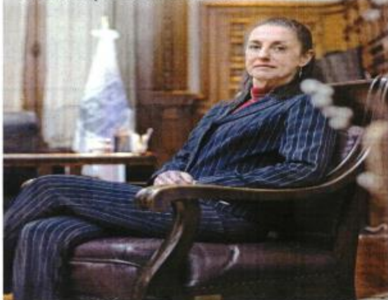
Claudia Sheinbaum define su administración con un gobierno de innovación y derechos.

Este año será para Sheinbaum de hacer frente a los desafíos de la pandemia y concretar proyectos de movilidad