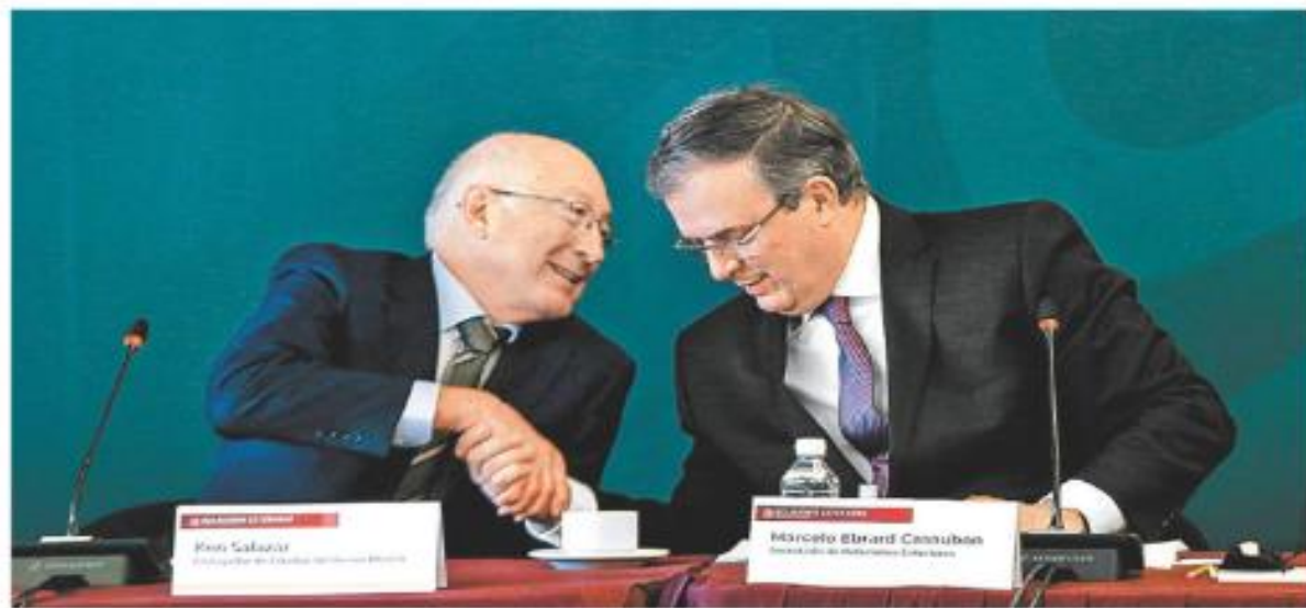
El embajador Ken Salazar y el canciller Marcelo Ebrard presentaron el plan de acción del Entendimiento Bicentenario.