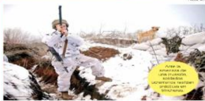
Ante la amenaza de una invasión, soldados ucranianos realizan ejercicios en el terreno.