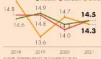
EU | Participación en su comercio, principales socios, ene-nov