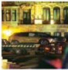
En la camioneta Mazda había ocho hombres y dos mujeres.

Aunque hace unos días los renovaron contratos por seis meses, personal del Hospital que labora en el Centro Médico Nacional 20 de Noviembre actual tuvo que despidos por pronto aviso. 7 B