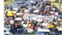
Manifestantes bloquearon la México-Querétaro.