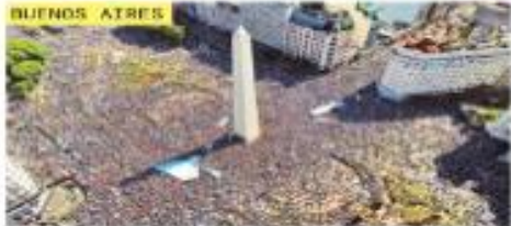
Miles de argentinos se congregan en torno al Obelisco de Buenos Aires para festejar la victoria de su Selección en Qatar