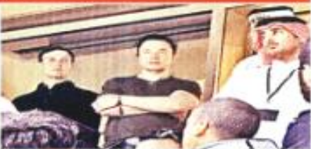
EN QATAR, Elon Musk (centro), dueño de Tesla, preside la final Argentina-Francia con Jared Kushner (izq.), yerno de Donald Trump, ex Presidente de EU.

*En conjunto con Panasonic. **Promesa a autoridades.