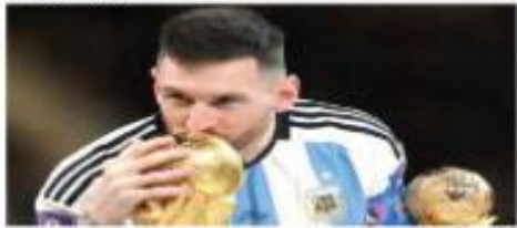
Lionel Messi besa la Copa del Mundo, el único trofeo que le faltaba en su extensa y exitosa trayectoria.

Liderada por Messi, Argentina se convirtió en campeona del mundo, por tercera ocasión, luego de 36 años. El astro albiceleste fue nombrado el mejor jugador de Qatar 2022.