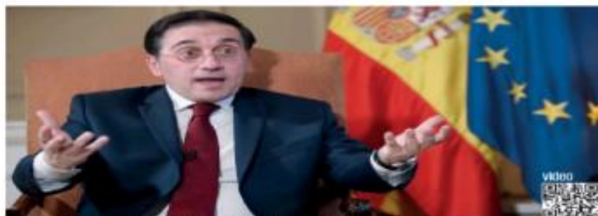
José Manuel Albares Buono, ministro de Asuntos Exteriores de España.

Ministro de Exteriores de esa nación afirma que no desean irse de México, pero necesitan seguridad jurídica