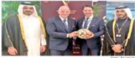
El presidente de la FIFA entregó a Yon de Laosa, titular de la AFA, la escudera rumbo al Mundial 2026, que organizará EU, México y Canadá.