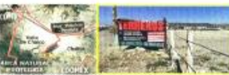
Tras ser cerrado un tiradero clandestino, rellenan un predio en el Área Natural protegida.

De acuerdo con la Asociación Mexicana de Rescate de Residuos de Construcción y Demoliciones (AMRECOC), la Ciudad de México se encuentra en crecimiento constante y el problema es dónde depositar las más de 14 mil toneladas de despendio de