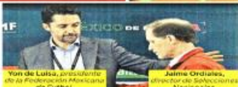
Yon de Luisa, presidente de la Federación Mexicana de Fútbol.

La pausa ocurrió luego de que 64 de los 69 integrantes de la bancada del PRI en San Lázaro aprobaran, junto con Morena y sus aliados, la reforma que promulgó la permanencia de los militares en temas de seguridad.