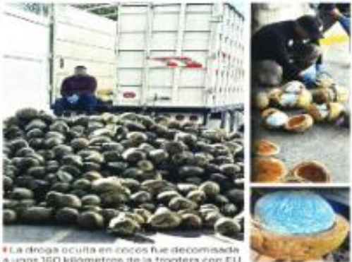
La droga oculta en cocos fue decomisada a unos 160 kilómetros de la frontera con EU.

"Los felices (a los seleccionados) porque ayer jugaron muy bien... y como suele pasar, hay mucha afición para tan poco desarrollo del deporte". "Lo que se tiene que hacer es terminar buenas futbolistas, que se puedan usar escuelas y que se destinen recursos con ese propósito, pero eso corresponde al sector privado. Si nosotros que ayudamos, lo hacemos, sobre todo por el entusiasmo de la gente, el respeto que merece la gente", agregó.