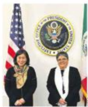
WASHINGTON. La secretaria de Economía revisó agenda amplia con USTR.

En un comunicado, la Secretaría de Economía informó que revisaron una agenda amplia y que se está trabajando estrechamente con la secretaria de Energía, Rocío Nahle. — México Día / PÁG. 4