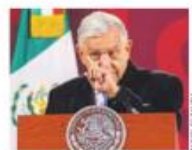
SALARIOS. Destaca presidente avanza del poder adquisitivo.