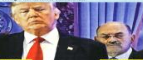
Donald Trump y Allen Weisselberg.

El ex Presidente de EU, Donald Trump, tiene abiertas varias investigaciones que podrían frustrar su aspiración de llegar de nuevo a la Casa Blanca.