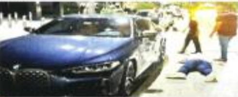
Peritos hallaron 9 casquitos de bala en donde fue asesinado el dirigente de bares y discotecas en la Costera de Acapulco.

Después de un intercambio, Rivera intentó huir en su auto pero quedó atrapado en el piso tras recibir varios impactos de bala.