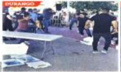
¡Golpes entre grupos rivales en Gómez Palacio y acosos masivos en autobuses en Cuernavaca, fueron dos estampas que ayer marcaron la elección de congresistas de Morena.

Morenistas que documentaron y advirtieron un