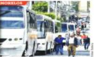
¡Golpes entre grupos rivales en Gómez Palacio y acosos masivos en autobuses en Cuernavaca, fueron dos estampas que ayer marcaron la elección de congresistas de Morena.