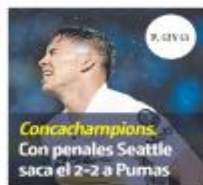
Concachampions. Con penales Seattle saca el 2-2 a Pumas

Un grupo de choque intentó tomar por asalto la planta de Cruz Azul Hidalgo en Tula y acabó con siete muertos de su bando, de los ocho resultantes del zafra por el control de la cooperativa, cuyos grupos en pugna se acusaron de ser los incitadores a la violencia. PÁG. 67