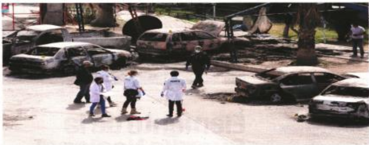
Partes inspeccionan el lugar, en el que había restos de sangre sobre el pavimento y al menos cinco vehículos incendiados. Trabajadores y vecinos aseguraron que durante el enfrentamiento mataron los operarios del empleo para asustarlos, a pesar de que se hacía al día desde el primer momento.