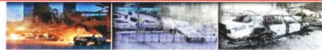
Flujo, vehículos quemados y barreras quemadas tras el enfrentamiento en Ciudad Cooperativa Cruz Azul, en Tula, Hidalgo.

En un desplegado titulado “Sin Educación de la