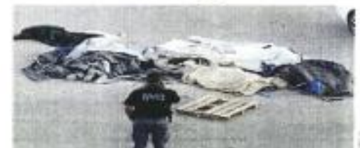
Ocho personas perdieron la vida y 11 más resultaron heridas.