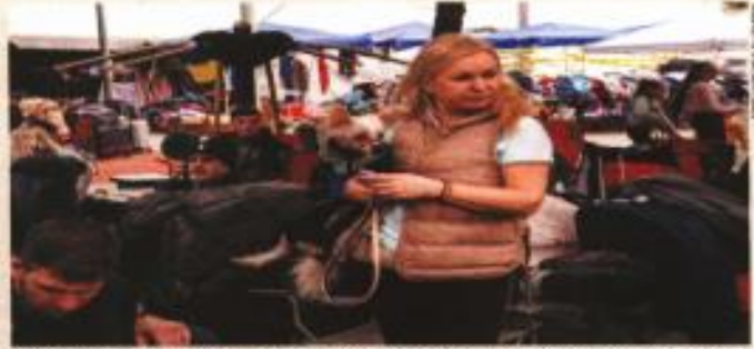
Los ucranianos son recibidos en el aeropuerto y llevados a un albergue con comida e internet.