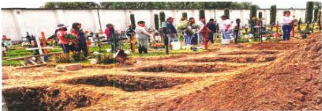
Para este sepelio al occidente, en el cementerio de Ahuacatán, se afloja de las ocho personas masacradas en Tultepec.

La Fiscalía del Distrito dijo que mantiene una intensa investigación para dar con los homicidas.