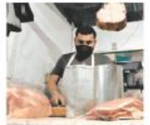
Correa vs. Grupo X. E. CASTAÑEDA

En Ciudad Hidalgo, Michoacán, la vigilia 2022 llegó antes de tiempo por la guerra entre cárteles del narcotráfico. PÁGS. 10