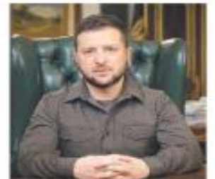
El dirigente ucraniano. AP

EL VILLAÉCHIA Y EL PEÑA, SEÑALÓ El gobierno de Pedro Sánchez expulsa a 27 diplomáticos rusos a consecuencia de la invasión a Ucrania. PÁGS. 26 Y 27