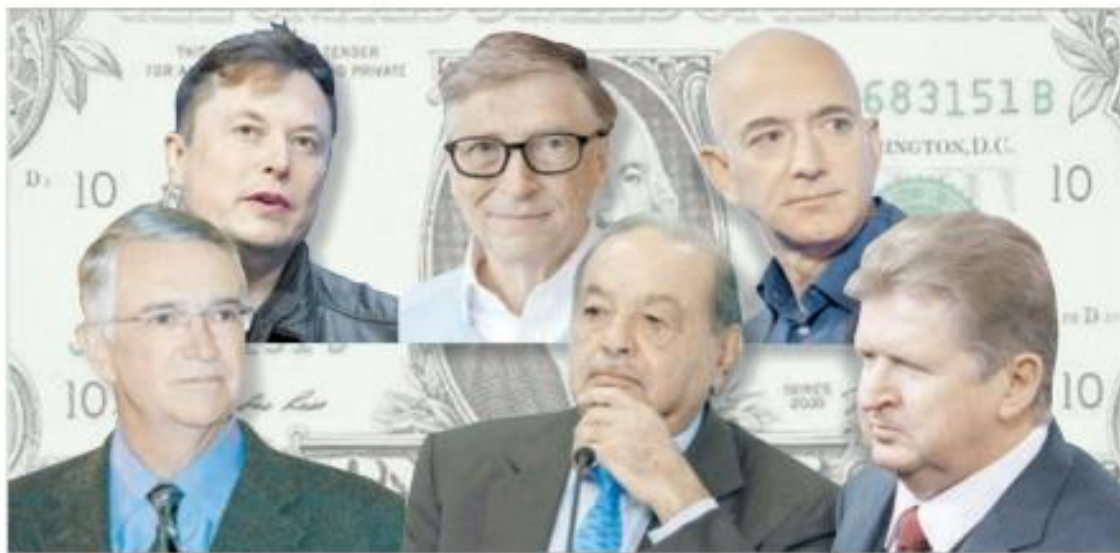
▲ Arriba: Elon Musk, fundador de Tesla (izquierda), es el más acaudalado del mundo con 219 mil mdd; al centro, Bill Gates, con 129 mil mdd, y a la derecha, Jeff Bezos, con 171 mil mdd; abajo: Ricardo Salinas, Carlos Slim y Germán Larrea.