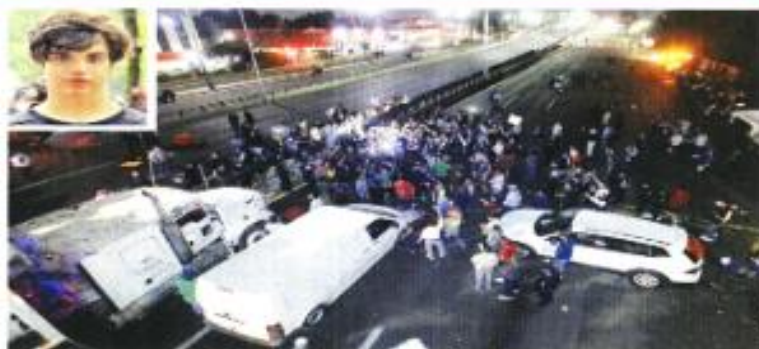
Los familiares y amigos protestaron por la muerte de Hugo.