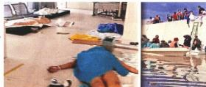
El Hospital del IMSS que se inundó se encuentra a tan sólo 100 metros del río Tula. Hubo 56 pacientes y 18 de ellos fallecieron por falta de oxígeno.

UNA MUJER, TODAS LAS MUJERES Opina sobre el tema Bárbara Hovio • Página 10