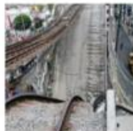
Estaban mal soldados.

Falla. El pandeo de las vigas Norte y Sur, ocasionado por la falta de pernos funcionales y mal soldados en el tramo elevado de la Línea 12 del Metro, fue la probable causa inmediata del desplome entre las estaciones Olivos y Tezozaco. Así lo dio a conocer el secretario de Obras y Servicios de la CDMX, Jesús Esteva, al presentar el dictamen final hecho por la empresa noruega DNV. PAG 12