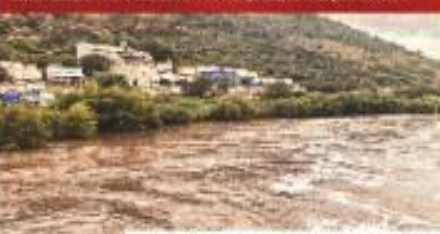
Gobierno Municipal Tula de Allende. El río desbordado a las 12:15.

Hace 4 días, el municipio y la Coahuila advertieron de la intensidad de las lluvias y de un desbordamiento, pero las autoridades no evacuaron al hospital, ni a la población.