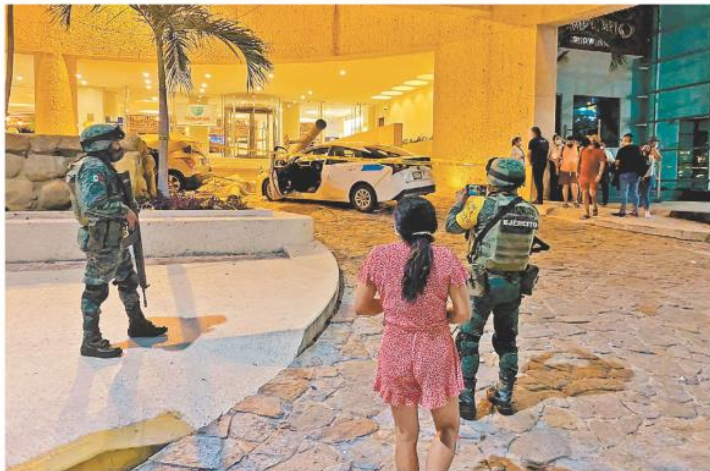
En CDMx funcionaron nueve de cada 10 altavoces por el temblor, que tuvo decenas de réplicas, una de alcance 5.2. La imagen, en Acapulco.