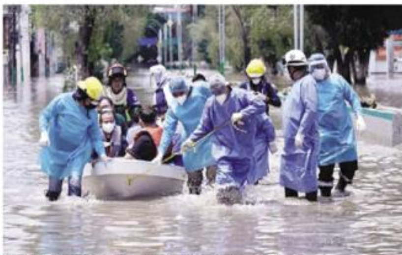
TULA, Hidalgo.- El hospital del IMSS se quedó sin energía eléctrica por las lluvias.