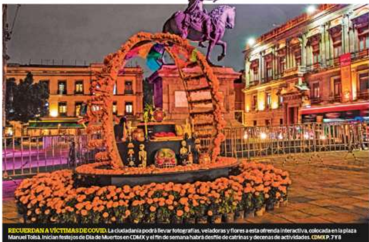
RECUERDAN A VÍCTIMAS DE COVID. La ciudadanía podrá llevar fotografías, veladoras y flores a esta ofrenda interactiva, colocada en la plaza Manuel Tolsá. Inician festejos de Día de Muertos en CDMX y el fin de semana habrá desfile de cafrinas y decenas de actividades. CDMX P. 7 Y 8

Falta de medicamentos oncológicos, anomalías en apoyos a personas con discapacidad o hijos de madres trabajadoras e incluso debilidades en el control de operación de la entrega de fertilizantes son algunas de las irregularidades halladas en el informe de la Cuenta Pública 2020 MÉXICO P. 4