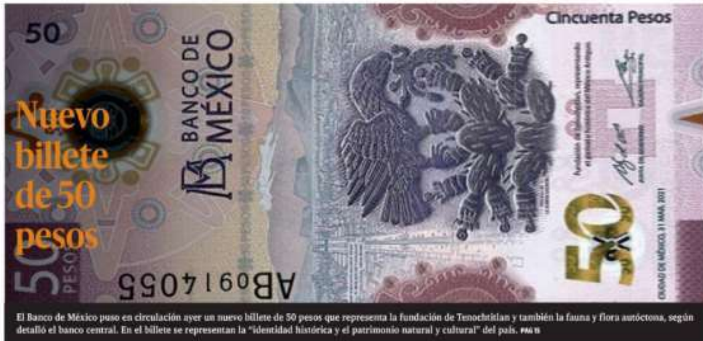
El Banco de México puso en circulación ayer un nuevo billete de 50 pesos que representa la fundación de Tenochtitlan y también la fauna y flora autóctona, según detalló el banco central. En el billete se representan la "identidad histórica y el patrimonio natural y cultural" del país. PAG 6