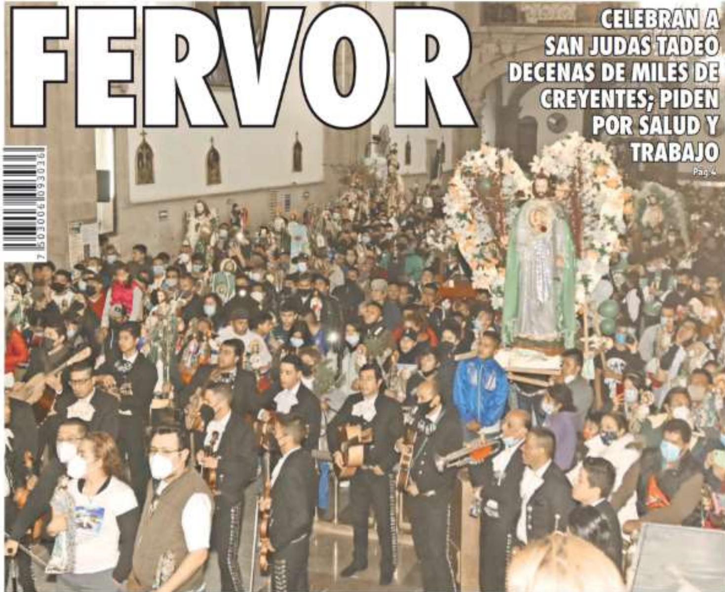
El Templo de San Hipólito lució abarrotado; el año pasado cerró por pandemia. DAVID DECARTE