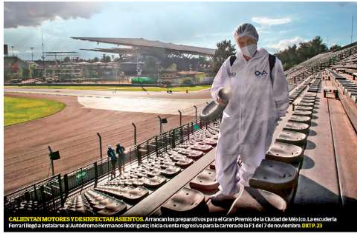
CALENTAN MOTORES Y DESINFECTAN ASIENTOS. Arrancan los preparativos para el Gran Premio de la Ciudad de México. La escudería Ferrari llegó a instalarse al Autódromo Hermanos Rodríguez; inicia cuenta regresiva para la carrera de la F1 del 7 de noviembre. DXTP. 23