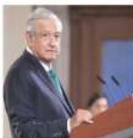
LÓPEZ OBRADOR. Podemos pasar la situación 2 o 3 años. ¿Y hasta cuándo? — El Financiero / PÁG. 53

Además, distorsionaría el despacho económico al aumentar costos de producción y amenazaría los compromisos de cambio climático, alerta. — Bloomberg / PÁG. 17