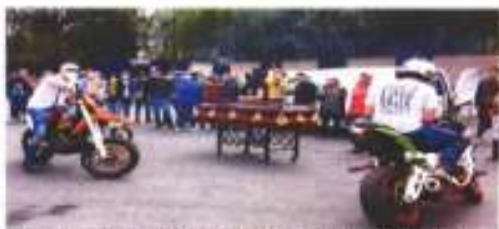
Antes de ser asesinado, realizaron algunas actividades al exterior del estado de Veracruz para darle el último adiós.

medios operados de las organizaciones delincuenciales van a seguir funcionando... Finalmente, a estos grupos se los tiene que atacar por varios frentes: primero hay que acabar con el acarreo, pero si no se combate la corrupción política, que es la que protege a las empresas, a facturas, a cárteles, no se va a llegar a ningún lugar", señaló. La consejera electoral Carla Humphrey recordó que el Instituto Nacional Electoral (INE) tiene pendiente el tema Odebrecht y reprochó la falta de datos del organismo acusatorio para acudir a instituciones de la voluntad política para obtener con la información que les es requerida, obstáculo que han vivido con la FGR en sus casos. | NACIÓN | A6