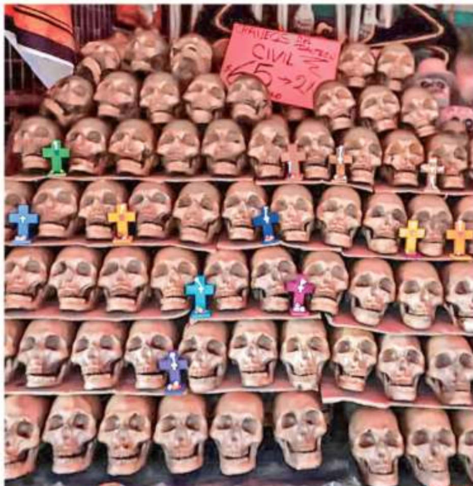
UN TZOMPANTLI PARA LA NORMALIDAD. Al mercado de Jamaica regresaron los dulces y adornos para el Día de Muertos, como las calaveras de azúcar y cartón, después de casi dos años de ausencia.