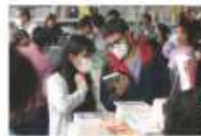
ASISTENTES. Ayer, el último día de la Feria del Libro en la CDMX.

Autores y lectores gozaron la primera feria presencial tras crisis de contagios; público abarrotó la plancha del Zócalo en la que se ofertaron 1 millón de ejemplares durante 11 días pág. 25