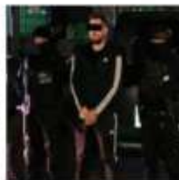
Uno de los detenidos.

Pesquisa. Fueron detenidos ayer cuatro personas relacionadas con el ataque a un empresario el pasado viernes en la Terminal 2 del AICM, informó el secretario de Seguridad Ciudadana capitalino, Omar García Harfuch. Dos de ellas son responsables directas de la agresión. Las capturas se realizaron durante tres cateos en domicilios en donde había fotografías de una de las víctimas. PÁG 12