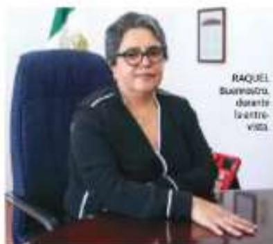
RAQUEL Buenrostro, durante la entrevista.

"ES MUY FLUIDA la reorientación (con el secretario de Hacienda), es una comunicación permanente y además es en la misma dirección, lo que hace el trabajo todavía más fácil. Venos muy bien"