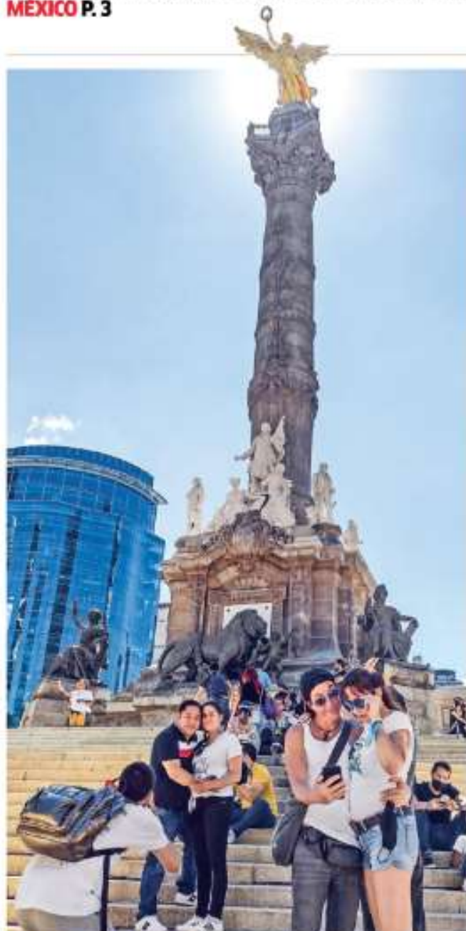
A LA SOMBRA DEL ÁNGEL. Ciudadanos aprovecharon que ya no hay vallas para descansar y tomarse fotos domingueras al pie del monumento CDMX P. 9

UN CONTRATO EXTEMPORÁNEO ASEGURÓ DEUDA MILLONARIA EN MH CDMX P. 7