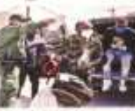
Más de 1.3 millones han sido detenidos en la frontera sur de EU.