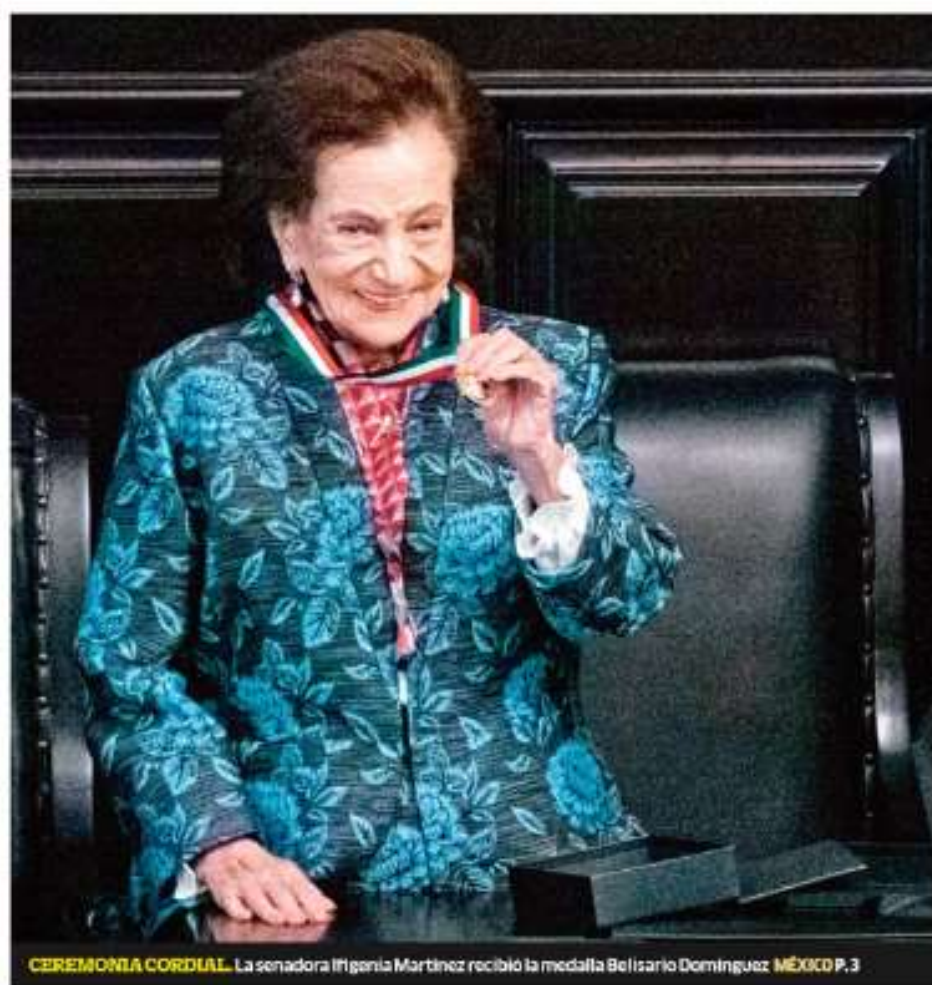
CEREMONIA CORDIAL. La senadora Ifigenia Martínez recibió la medalla Belisario Domínguez MÉXICO P. 3