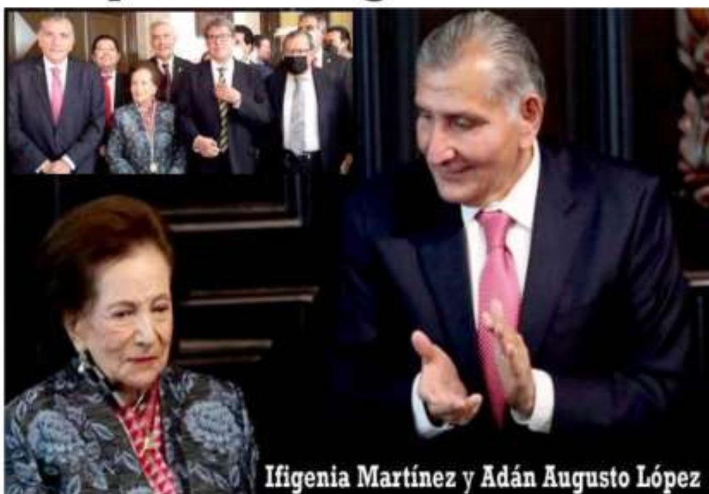
Ifigenia Martínez y Adán Augusto López

Entrega de Medalla Belisario Domínguez Es tiempo para la unidad de la república: Ifigenia Martínez