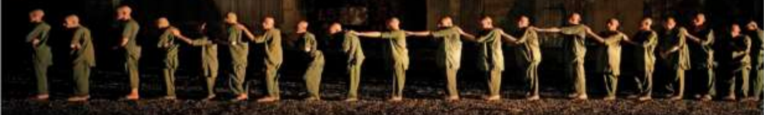
Kabul. — Drogadictos afganos esperan formados para ingresar al pabellón de "desintoxicación" en el Hospital Médico Avicena. Tras regresar al poder, los talibanes están decididos a acabar con las adicciones, aunque sea por la fuerza. Los adictos son detenidos, golpeados y llevados a centros de tratamiento que carecen de una adecuada atención médica o suministros básicos. Sus familias difícilmente saben de su paradero. | MUNDO | A23