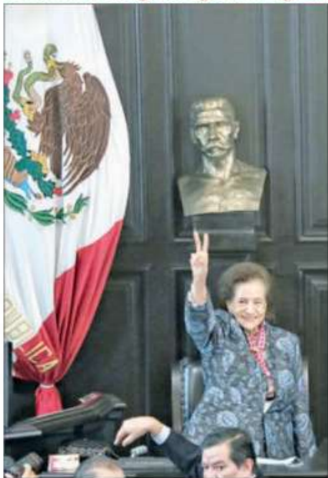
▲ La maestra, en sesión solemne del Senado