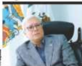
JAIME Bonilla, en entrevista con Lo Razón.

Gobernador de BC señala que hay diputados, alcaldes y gobernadores que no tienen pensamiento del movimiento en su gestión. Les suspendió el sueldo por profundo de su estado. confiesa pág. 8